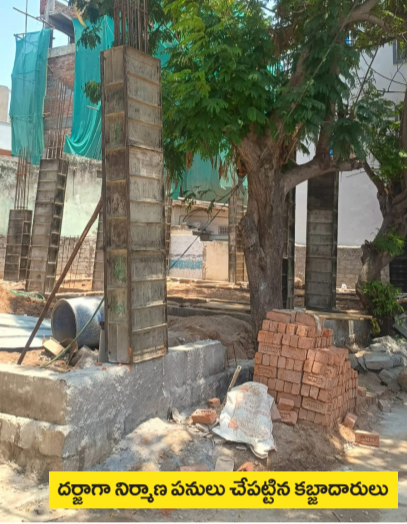
దర్జాగా నిర్మాణ పనులు చేపట్టిన కట్టాదారులు

హైదరాబాద్ విశాలభారతి: ప్రభుత్వ ఆస్తులకు రక్షణ కరువైంది. కోట్లాది రూపాయల విలువైన సర్కారు భూములు కళ్ల ముందే కట్టాకు గురవుతున్నాయి. సంబంధిత శాఖల అధికారులు మాత్రం నిమ్మకు నీరెత్తినట్లు వ్యవహరిస్తున్నారు. శేరిలింగంపల్లి మండలం సందయ్యనగర్ కాలనీలో సుమారు రూ. 3 కోట్ల విలువ చేసే 200 గజాల ప్రభుత్వ స్థలం అక్రమార్కుల పాలుకావడం ఇప్పుడు తీవ్ర కలకలం రేపుతోంది. గత 25 ఏళ్లుగా సర్కారు రికార్డుల్లోనే ఉన్న ఈ స్థలాన్ని నకిలీ పత్రాలతో రిజిస్ట్రేషన్ చేయించుకుని, యథేచ్ఛగా నిర్మాణ పనులు చేపడుతున్నారని, మున్సిపల్, రిజిస్ట్రేషన్ శాఖలు చోద్యం చూడటం వెనుక భారీ హస్తమే ఉందనే ఆరోపణలు వెల్లువెత్తుతున్నాయి.