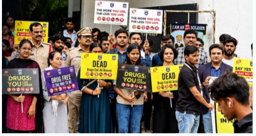
మత్తు పదార్థాల వ్యతిరేక దినోత్సవం సందర్భంగా కేపీహెచ్బీలో ఫిర్యాదులతో ర్యాలీ నిర్వహించిన విద్యార్థులు, పోలీసులు

150 మంది విద్యార్థులతో అవగాహన కార్యక్రమం కూకట్ పల్లి విశాల భారతి : అంతర్జాతీయ మత్తు పదార్థాల వ్యతిరేక దినోత్సవం సందర్భంగా కేపీహెచ్బీ పోలీసులు అవగాహన ర్యాలీ నిర్వహించారు. సర్కార్ హిల్స్ సగర్ నుంచి నిజాంపేట్ ప్రధాన రహదారి వరకు సాగిన ర్యాలీలో ఇనుమకాటిక్స్, ఏఐ శిక్షణ కేంద్రం సహకారంతో 150 మంది విద్యార్థులు పాల్గొన్నారు. మత్తు వస్తు... మంచి భవిష్యత్తు ముద్దు! " మత్తు పదార్థాలకు వడ్డనంది - జీవితానికి నరేననంది " అంటూ నినాదాలు చేస్తూ విద్యార్థులు, పోలీసులు ప్రజాభివృద్ధి నిలయాలు, కార్యక్రమంలో కేపీహెచ్బీ పోలీస్ స్టేషన్ ప్రధాన అధికారి, పరిశోధన అధికారి, సిబ్బంది పాల్గొన్నారు.