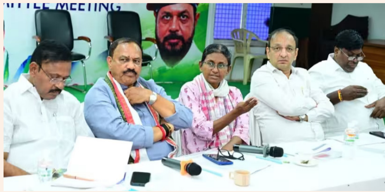
విశాలభారతి, స్టేట్ బ్యూరో:

బీజేపీ 'సీట్ల చోరీ' చేస్తుందన్న రాహుల్ మాట నిజం