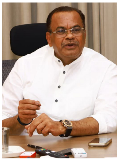
నుంచి గుర్రంపాడు, మల్లపల్లి, దేవరకొండ మీదుగా దిండి వరకు 300 కోట్ల రూపాయల వ్యయంతో డివైడర్ తో కూడిన డబుల్ రోడ్డు నిర్మాణానికి శ్రీకారం చుట్టనున్నారు.

తెలంగాణ రాష్ట్ర రహదారుల వ్యవస్థను జాతీయ ప్రమాణాలతో తీర్చిదిద్దేందుకు ప్రజా ప్రభుత్వం చారిత్రక అడుగులు వేస్తోంది. అందులో భాగంగా హైదరాబాద్ యాన్టూటీ మోడల్ పద్ధతిలో 13,000 కోట్ల రూపాయల భారీ వ్యయంతో 6,300కిలోమీటర్ల మేర రహదారులను డబుల్ రోడ్డుగా విస్తరించే పనులకు ఈ నెల 17న ముఖ్యమంత్రి ఎన్ డిఆర్ రెడ్డి శంకుస్థాపన చేయనున్నారు. నల్గొండ జిల్లా కనగల్ వేదికగా జరిగిన ఈ భారీ బహిరంగ సభలో ప్రభుత్వం ఈ మేగా ప్రాజెక్టును అధికారికంగా ప్రారంభించినది. గత ఏడాది కాలంగా మంత్రి కోమలిరెడ్డి వెంకట్ రెడ్డి పర్యవేక్షణలో 34 ప్రాజెక్టుల బాగా పూర్తి చేసిన బెడదర్ల ప్రత్యయ ద్వారా ఈ పనులకు ఇప్పటికే వర్ష ఆర్ద్రుల జారీ చేశారు. దీనికి తోడు పంచాయితీరాజ్ శాఖ ఆధ్వర్యంలో మరో 7,000 కోట్ల రూపాయల నిధులతో చేపట్టే పనులకు కలుపుకుని రాష్ట్రవ్యాప్తంగా మౌలిక వసతుల కల్పనకు ఊతం లభించినది. నల్గొండ జిల్లాలో రెండు కిలీ ప్యాకేజీల ద్వారా రూపాయల రూపొందించిన మారనున్నాయి. ధర్మశివుల