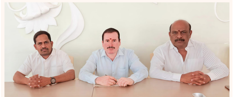
సైబరాబాద్, విశాఖభారతి: సైబర్ నేరగాళ్లకు సహకరించి అక్రమంగా కరెంట్ ఖాతాలు తెరిచిన 7 మంది బ్యాంక్ అధికారులను సైబరాబాద్ సైబర్ క్రైమ్ కేసులో అరెస్టు చేశారు.

తెలంగాణ రాజకీయాల్లో చారిత్రాత్మక మలుపు... సామాజిక తెలంగాణ సాధన లక్ష్యంగా ముందుకు టీఆర్ఎస్