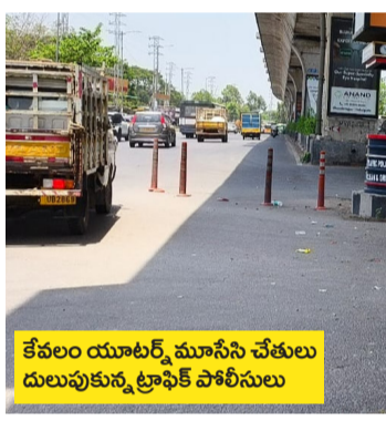
కేవలం యూటర్న్ మూసిన చేతులు దులుపుకున్న ట్రాఫిక్ పోలీసులు

జరుగుతున్న వచ్చే ప్రతి ట్యాంకర్ కు జీవితం ఉంది. రూల్ మ్యాప్ ఉంది. అయినా రాంగ్ రూల్ లో వెళ్తున్న డ్రైవర్లపై చర్యలేవి? ఒక్క కాంట్రాక్ట్ రద్దు కాలేదు. ఒక్కరికీ జరిమానా లేదు.