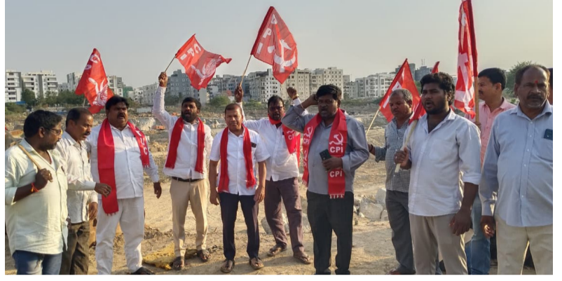
కబ్జాకు గురైన చెరువు వద్ద నిరసన తెలియజేస్తున్న సిపిఐ నాయకులు

అయిన చర్యలపై తాము ఏమాత్రం సంకల్పిస్తామో... తెలంగాణ ప్రజలకు చెరువులను పరిరక్షించేందుకు సిపిఐ పార్టీ నాయకులు నిరసన వ్యక్తం చేశారు.