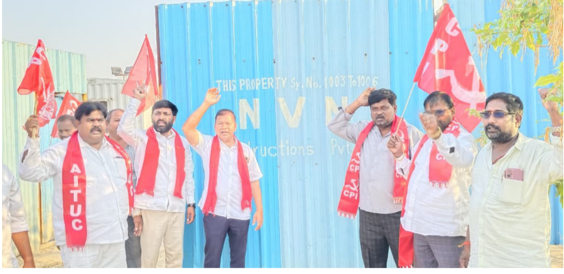
కబ్జాకు గురైన ఈదులకుంట వద్ద సిపిఐ పార్టీ నాయకుల నిరసన

చెరువు మాయం చేసి సెల్లార్ తవ్వకున్నా చర్యలేవి: సిపిఐ పైరే