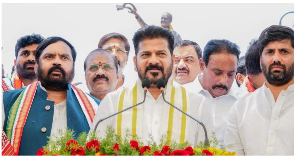
విశాలభారతి, స్టేట్ బ్యూరో: