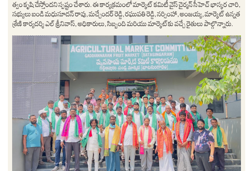
రైతు బాగు కోసం సహకార పరపతి సంఘాలు. రైతు బాగు కోసం సహకార పరపతి సంఘాలు.