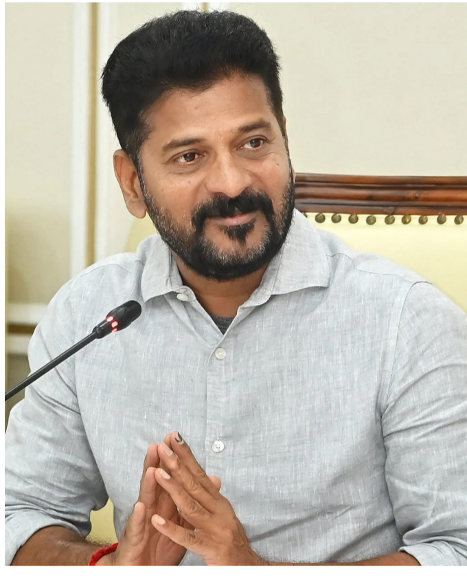
పరిమితం కాకుండా గ్రామాలకు సైతం ప్రగతి ఫలాలను అందించేలా కార్యచరణ ఉండాలని అధికారులకు దిశ నిర్దేశం చేశారు. రాష్ట్ర రాజధాని హైదరాబాద్ ను కేవలం సాఫ్ట్ వేర్ సేవలకే కాకుండా, అత్యాధునిక ఆవిష్కరణలకు కేంద్రంగా మార్చాలని ప్రభుత్వం సంకల్పించింది. ప్రపంచ స్థాయి ప్రమాణాలతో నిర్మించనున్న 'ఏజి సిటీ' ఈ దిశగా ఒక కీలక అడుగు కానుంది. దాదాపు 200 ఎకరాల విస్తీర్ణంలో నిర్మించవలసిన ఈ కృత్రిమ మేధ నగరంలో అంతర్జాతీయ సంస్థలు తమ కార్యకలాపాలను ప్రారంభించేలా ప్రోత్సాహకాలు ఇవ్వనున్నారు. ఇది కాకుండా, క్యాంటం కంప్యూటింగ్ మరియు సైబర్ సెక్యూరిటీ రంగాల్లో పరిశోధనలను ప్రోత్సహించేందుకు ప్రత్యేకంగా హాబిలను ఏర్పాటు చేయాలని సమావేశంలో తీర్మానించారు. ఈ ప్రాజెక్టుల ద్వారా మిగతా 3లో..

విశాలభారతి, స్టేట్ బ్యూరో: తెలంగాణ రాష్ట్ర భవిష్యత్తును సరికొత్త శిఖరాలకు చేర్చేలా ప్రభుత్వం సముగ్ర పూర్వచరణ చేస్తోంది. రాష్ట్ర సర్వతోముఖాభివృద్ధిని దృష్టిలో ఉంచుకుని అటు పారిశ్రామికంగా, ఇటు సామాజికంగా సమానమైన పురోగతిని సాధించడమే లక్ష్యంగా ప్రణాళికలు రూపొందిస్తోంది. దీనిపై ముఖ్యమంత్రి కార్యాలయంలో అత్యున్నత స్థాయి సమావేశం జరిగింది. రాష్ట్రంలో రానున్న ఐదేళ్లలో చేపట్టబోయే కీలక ప్రాజెక్టులు, మౌలిక సదుపాయాల కల్పన, మరియు యువతకు ఉపాధి కల్పించే అంశాలపై ఈ చర్చలు సుదీర్ఘంగా సాగాయి. గత కొన్నేళ్లుగా సాగుతున్న అభివృద్ధిని మరింత వేగవంతం చేస్తూ, కొత్తగా అందుబాటులోకి వస్తున్న సాంకేతికతను ఉడిసిపట్టుకోవాలని ప్రభుత్వం ఈ సందర్భంగా నిర్ణయించింది. కేవలం నగరాలకే