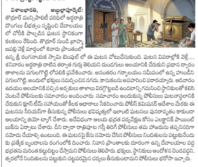
అర్ధరాత్రి డొంగలు బీభత్సం సృష్టించే దేవాలయంలో చోరీకి పాల్పడిన ఘటన స్థానికంగా కలకలం రేపింది.

విశాలభారతి, అబ్దులాహ్లాల్ మెట్: అర్ధరాత్రి డొంగలు బీభత్సం సృష్టించే దేవాలయంలో చోరీకి పాల్పడిన ఘటన స్థానికంగా కలకలం రేపింది. తొర్రూర్ నుండి బ్రాహ్మణుల బస్ వెళ్లిన మార్గంలో శివారు ప్రాంతంలో ఉన్న శ్రీ రంగనాయక స్వామి దేవాలయంలో ఈ ఘటన చోటుచేసుకుంది. ఘటన వివరాల్లోకి వెళ్తే... శనివారం అర్ధరాత్రి దాటితే తర్వాత గుర్తు తెలియని దుండగులు ఆలయానికి చేరుకుని ప్రధాన ద్వారం తాళాలను పగులుగొట్టి తోపలికి ప్రవేశించారు. అనంతరం గర్భాలయం సమీపంలో ఉన్న హుండిని పగులుగొట్టి, అందులో భక్తులు సమర్పించిన నగదు, కాసుకలలు అపహరించి పరారయ్యారు. ఉదయం ఉదయం ఆలయానికి వచ్చిన అర్చకులు తాళాలు విగ్గబట్టడం ఉండటాన్ని గమనించి స్థానికులతో కలిసి వెతుకుని పోలీసులకు సమాచారం అందించారు. సమాచారం అందుకున్న పోలీసులు ఘటనాస్థలానికి చేరుకుని క్షాన్ టీమ్ సహాయంతో కీలక ఆధారాలు సేకరించారు. పోలీస్ కమిషనర్ ఆదేశాల మేరకు ఈ ఘటనను సీరియస్ గా తీసుకున్న పోలీసులు భవిష్యత్తులో ఇలాంటి ఘటనలు పునరావృతం కాకుండా ఆలయాన్ని జయో ట్యాగ్ చేశారు. అదేవిధంగా ఆలయ భద్రత పర్యవేక్షణ కోసం ఎలక్ట్రానిక్ పాయింట్ బుకెను ఏర్పాటు చేశారు. దీని ద్వారా రాత్రిపూట గన్నీ తిరిగి పోలీసులు తమ హాజరును తప్పనిసరిగా సమాధి చేయాలి ఉంటుంది. ఈ ఘటనపై కేసు సమాధి చేసిన పోలీసులు నిందితులను పట్టుకునేందుకు ప్రత్యేక బృందాలను రంగంలోకి దింపారు. నివాస ప్రాంతాలకు దూరంగా ఉన్న దేవాలయాల వద్ద భద్రతను మరింత కట్టుదిట్టం చేస్తామని పోలీసులు తెలిపారు. భక్తులు, స్థానికులు అందోళన చెందవద్దని, త్వరలోనే నిందితులను పట్టుకుని చట్టపరమైన చర్యలు తీసుకుంటామని పోలీసులు భరోసా ఇచ్చారు.