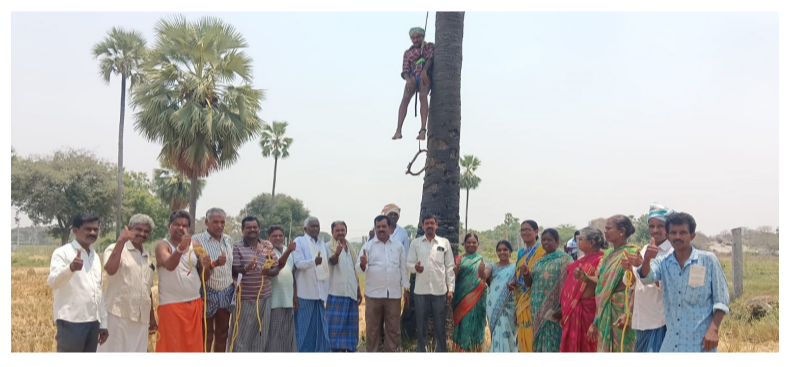
దాలకు ఘననియంగా తగ్గించవచ్చని సూచించారు. అలాగే రాంబోజిగూడెం ఒక గీత కార్మికుని కుటుంబం నివాసం కూడా మాట్లాడుతూ, ప్రభుత్వం అందిస్తున్న కాటమయ్య రక్షణ కిట్లు ఎంతో ఉపయోగకరంగా ఉన్నాయని, ఇవి ప్రమాదం నుండి నివారించడంలో సహాయపడుతున్నాయని తెలిపారు.

దాలకు ఘననియంగా తగ్గించవచ్చని సూచించారు. అలాగే రాంబోజిగూడెం ఒక గీత కార్మికుని కుటుంబం నివాసం కూడా మాట్లాడుతూ, ప్రభుత్వం అందిస్తున్న కాటమయ్య రక్షణ కిట్లు ఎంతో ఉపయోగకరంగా ఉన్నాయని, ఇవి ప్రమాదం నుండి నివారించడంలో సహాయపడుతున్నాయని తెలిపారు. ప్రతి కార్మికుడి ఈ కిట్లను ఉపయోగించి తమ కుటుంబాన్ని రక్షించుకోవాలని, కోరారు ఈ కార్యక్రమంలో సర్పంచ్ పరిధుల వారి కిట్లను అధికారులు మాట్లాడుతూ, భువిపై ఉన్న వ్యక్తులలో ప్రమాదకరమైన వృత్తి కర్మ గ్రూపున్న గౌడ స్వామి పుల్లి అత్యంత ప్రమాదకరమని పేర్కొన్నారు. జిల్లాలో ఇప్పటికే సుమారు ఉదయం మంది గీత కార్మికులు సుస్థితిలో పనిచేసి చనిపోయారు. ప్రతి గీత కార్మికుడు ఈ కిట్లను తప్పనిసరిగా ఉపయోగించుకుని తమ ప్రాణాలు కాపాడుకోవాలని కుటుంబ వ్యవహారం ద్వారా దానిని తెలిపారు. ఈ కిట్లను ఉపయోగించుకోవాలి అని వీటి వినియోగంతో ప్రమాదాలను నివారించవచ్చని సూచించారు.