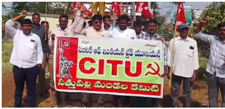
దేశవ్యాప్తంగా జరుగుతున్న ఆందోళనలలో భాగంగా ధర్మానిర్వహించారు. ఈ సందర్భంగా మాట్లాడుతూ, కేంద్ర ప్రభుత్వం నాలుగు లెబర్ కోడ్లను ఏప్రిల్ 1 వ తేదీ నుండి దేశవ్యాప్తంగా అమలు చేయాలని సిద్ధ

మైంది. దీనికి వ్యతిరేకంగా ఈ నిరసన కార్యక్రమం చేపట్టినట్లు తెలిపారు. కేరళ రాష్ట్ర ప్రభుత్వం నాలుగు లెబర్ కోడ్లను తమ రాష్ట్రంలో అమలు చేయబోమని ఆ సెంట్రీలో తీర్మానం చేసిందిని గుర్తుచేశారు. అదే