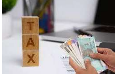
చేసింది. ఈ క్రమంలోనే మార్చి 30,31న సెలవులు ఉన్నప్పటికీ ప్రజల ఆస్తి పన్ను చెల్లించవచ్చని పేర్కొంది. రెండు మూడు రోజుల్లో ఆస్తిపన్ను చెల్లించి వడ్డీపై 90 శాతం రాయితీని సద్వినియోగం చేసుకోవాలని పురపాలక శాఖ సూచనలు చేసింది.

పన్నుపై వడ్డీలో 90 శాతం రాయితీ ఇవ్వాలని పురపాలక శాఖ నిర్ణయం తీసుకుంది. ఈ అవకాశాన్ని ప్రజలు సద్వినియోగం చేసుకోవడం వల్ల ఆస్తిపన్నుకు సంబంధించిన వసూళ్లు రూ.1000 కోట్లు దాటింది. ఈ మేరకు రాష్ట్ర పురపాలక శాఖ ఈ విషయాన్ని వెల్లడించింది. తెలంగాణలో కార్పొరేషన్లు, మున్సిపాలిటీల్లో ఇప్పటిదాకా రూ.1010 కోట్ల వరకు ఆస్తిపన్ను వసూలైందని తెలిపింది. మార్చి 31 నాటికి ఆస్తిపన్ను బకాయిలపై 10 శాతం వడ్డీ చెల్లించిన వాళ్లకే ఓటీఎస్ వర్తిస్తుందని పురపాలక శాఖ స్పష్టం