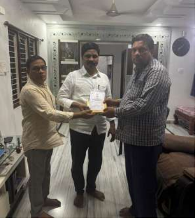
మంత్రి రేవంత్ రెడ్డి ప్రజలకు సన్న బియ్యం పంపిణీ కి లాంఛనంగా శ్రీకారం చుట్టడం అభినందనీయమన్నారు.