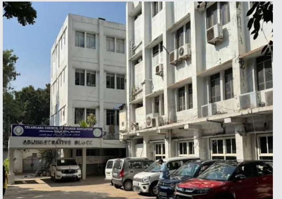
2400 విద్యార్థులకు 32 మంది ఫ్యాకల్టీ

ఏబిసీటీఈ నిబంధనల ప్రకారం ప్రతి 60 మందికి ఒక ప్రొఫెసర్, ఇద్దరు అసిస్టెంట్ ప్రొఫెసర్లు, నలుగురు అసిస్టెంట్ ప్రొఫెసర్లు ఉండాలి. ఈ లెక్కన 2,400 మంది విద్యార్థులకు దాదాపు 120 మందికి పైగా అధ్యాపకులు ఉండాలి. కానీ కేవలం 35 మంది ఫ్యాకల్టీలను పెట్టి కళాశాలను నడుపుతున్నారంటే పరిస్థితి ఎంత దారుణంగా ఉందో అర్థం చేసుకోవచ్చు. పీహెచ్ డీ, ఎంఫిల్ చేసిన వాళ్లకు అయితే అత్యధిక జీతాలు ఇవ్వవలసి వస్తుందని, తక్కువ జీతాలతో బీటెక్, ఎంటెక్ అయిపోయిన వారితో బోధన చేయిస్తున్నారు. జేఎన్టీయూ పరిధిలోని దాదాపు 76 కళాశాలల్లో కంప్యూటర్ ల్యాబ్ రేట్ల లీలు లేవంటే ఎంత