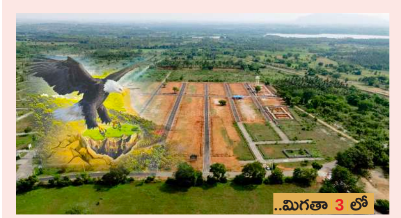
..మిగతా 3 లో