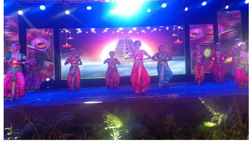
మంది విద్యార్థులను ఉన్నత శిఖరాలలో ఉంచాలని ఉద్దేశంతో కుంట్లూరు ప్రాంత ప్రజలకు అందుబాటులో ఉండే విధంగా ఈ విద్యాసంస్థను ఇక్కడ నిర్మించడం నాకు చాలా