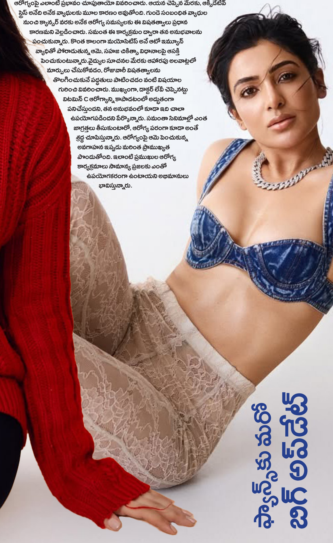
ఫ్యాన్స్ కు మరో బిగ్ అప్ డేట్