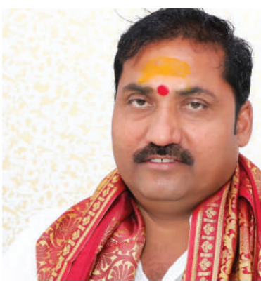
గుట్టా, పేకాట, ఇసుక అక్రమ రవాణాకు సంబంధించి ఎట్టి పరిస్థితుల్లోనూ రాజీపదే ప్రసక్తేలేదన్నారు.

అమీన్ పూర్ మున్సిపాలిటీ పరిధిలోని బీరం గూడలో మహాశివరాత్రిని పురస్కరించుకొని శ్రీ భ్రమరాంబిక మల్లికార్జున స్వామి ఉత్సవాలు ఐదు రోజుల పాటు కొనసాగునున్నాయని బీరంగూడ శ్రీ భ్రమరాంబిక మల్లికార్జున