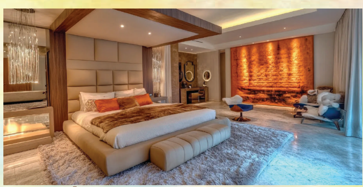
విశాలభారతి, హైదరాబాద్ :

మెట్రో నగరాల్లో లగ్జరీ హోమ్స్ ఎవర్ గ్రీన్ ప్రాజెక్టులుగా నిలుస్తున్నాయి. కాలానుగుణంగా మారుతున్న అభిరుచులకు అనుగుణంగా సువిశాలమైన ఇండ్లకు కొనుగోలుదారులు ప్రాధాన్యతనిస్తున్నారు. ముఖ్యంగా కరోనా తర్వాత లగ్జరీ ఇండ్ల ట్రెండ్ అన్ని మెట్రో నగరాల్లో ఎక్కువైంది చెప్పాలి. ఇక అప్పటి నుంచి లగ్జరీ ప్రాజెక్టుల నిర్మాణంలో హైదరాబాద్ దూసుకుపోతూనే ఉంది. సంవత్సరాలు కుడా ఈ తరహా ప్రాజెక్టులను కొనుగోలు చేసేందుకు ప్రాధాన్యతనిస్తున్నారు. హెచ్ఎన్ఐ వర్గాలకు అనువైన లగ్జరీ ప్రాజెక్టులు అందుబాటులోకి వస్తూనే ఉన్నాయి. అత్యధిక ఆదాయ వనరులు, బడా వ్యాపారవేత్తలు, విదేశీయులతో, ప్రవాసియులు హై ఎండ్ విలాసవంతమైన గృహాలను కొనుగోలు చేసే జాబితాలో ఉన్నారు. దీంతో బల్లర్లు కూడా ఈ తరహా ప్రాజెక్టుల నిర్మాణానికి ప్రాధాన్యత చూపుతున్నారు. ఇలా శివారులోని కోపాపేట్, తెల్లూపూర్, నార్సింగి, మంచెరేవుల వంటి ప్రాంతాలతోపాటు, నగరంలోని జాబ్లీ హిల్స్, బంజారాహిల్స్, గచ్చిబౌలి, కొండాపూర్ వంటి ప్రాంతాల్లో ఉండే భారీ విస్తీర్ణంలో ఉండే బడా బంగ్లాలుకు వేదికగా నిలుస్తున్నాయి. వీటిని కొనుగోలు చేసే వారికి అనుగుణంగా ప్రాజెక్టుల నిర్మాణం జరుగుతూనే ఉంది. అయితే లగ్జరీ భవనాల ట్రెండ్ కరోనా కాలం తర్వాత హైదరాబాద్ కేంద్రం అనూహ్యంగా పెరిగిన విషయం తెలిసిందే. దీంతో ప్రాధారణ డబుల్ బెడ్రూం ఇండ్ల తరహాలో లగ్జరీ, స్పెసియల్ ప్రాజెక్టులలో ఇండ్లను కొనుగోలు చేసే వారి గణనీయంగా పెరుగుతుండటం విశేషం.