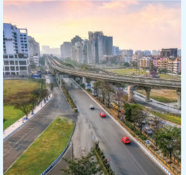
నగరంలో మరిన్ని పారిశ్రామిక వాడలు...

కొత్తగా వచ్చే పెట్టుబడులతో నగరంలో విప్లవాత్మక మార్పులు చోటుచేసుకోనున్నాయి. ముఖ్యంగా హైదరాబాద్ కేంద్రంగా ప్రస్తుతం ఉన్న పారిశ్రామిక వాడల విస్తీర్ణం మరింత పెరగనుంది. ప్రస్తుతం ఐటీ రంగం కేంద్రీకృతమైన వెస్ట్ సీటీ నగరం నలువైపులా విస్తరించే అవకాశం ఏర్పడుతుంది. ప్రస్తుతం అదిభట్ల, పోచారం వంటి ప్రాంతాలు ఐటీ కేంద్రాలు మారుతుండగా... కొత్తగా వచ్చే ఫోర్ట్ సీటీ, నగరం నలువైపులా విస్తరించే ఇతర పరిశ్రమలతో ఇండస్ట్రియల్ జోన్లతో కళకళలాడనుంది. ఇక నగరానికి రీజనల్ రింగు రోడ్లు వలన హైదరాబాద్ చుట్టూ పారిశ్రామిక వాడలతో హైదరాబాద్ మరింత ఉన్నత స్థానానికి చేరుకోనుంది.