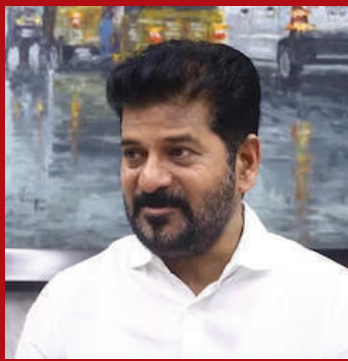
విశాలభారతి, స్టేట్ బ్యూరో:

హీరో అల్లు అరెస్ట్ వ్యవహారం సంచలనంగా మారింది. అరెస్ట్ తుపలుపుచు సీసీ, రాజకీయ ప్రముఖులు ఖండిస్తున్నారు. అయితే ఈ కేసుపై తెలంగాణ ముఖ్యమంత్రి రేవంత్ రెడ్డి స్పందించారు. శుక్రవారం ఢిల్లీలో ఆజ్ తక్ ఇంటర్వ్యూలో మాట్లాడిన ఆయన.. దేశంలో అంబేద్కర్ రచించిన రాజ్యాంగం ఉంది.. దానికి అనుగుణంగానే చట్టం పనిచేస్తుందని చెప్పారు. "అల్లు అర్జున్ అరెస్టు చేశామంటున్నారు. అక్కడ మహిళ