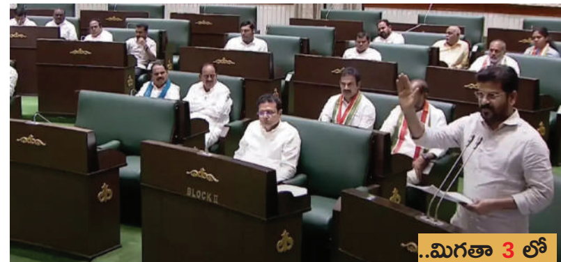
..మిగతా 3 లో