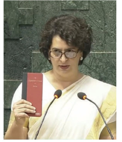
ధరించి ప్రియాంకా సభకు వచ్చారు. నేడు లోక్ సభ ప్రారంభమైన వెంటనే స్పీకర్ ఓం బిర్లా కొత్తగా ఎన్నికైన సభ్యులతో

విశాలభారతి, స్టేట్ బ్యూరో: కాంగ్రెస్ నాయకురాలు ప్రియాంకా గాంధీ తొలిసారి లోక్ సభలో అడుగుపెట్టారు. ఇటీవల కేరళలోని పయనాద్ లోక్ సభ ఉప ఎన్నికలో భారీ విజయాన్ని సొంతం చేసుకున్న ఆమె.. గురువారం ఎంపీగా ప్రమాణ స్వీకారం చేశారు. సోదరుడు, ఎంపీ రాహుల్ గాంధీ, ఇతర నేతలు వెంట రాగా.. కేరళ సంప్రదాయాన్ని ప్రతిబింబించే 'కసాపు' చీర