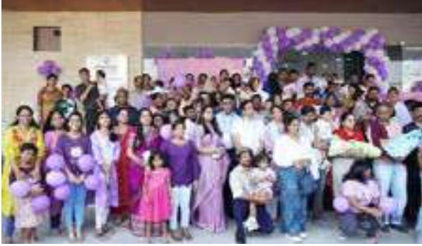
ప్రీ మెచ్చూరిటీ బేబీ తల్లిదండ్రులతో కలిసి పాల్గొన్న హాస్పిటల్ వైద్య బృందం.