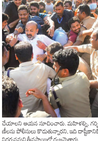
చేయాలని ఆయన సూచించారు. మహిళాల్ని గర్భిణీలు పోలీసులు కొడుతున్నారని, ఇది దాష్టీకానికి నిదర్శనమని తీవ్రస్థాయిలో ధ్వజమెత్తారు.

మొదటివేళే తరువాతి: సెక్రటేరియట్ వైపు వెళ్తుండగా పోలీసులు అడ్డుకున్నారు. దీనికి నిరసనగా బండి సంచలన రోడ్డుపై బైటాయించారు. దీంతో ఆయనకు పోలీసులు అదుపులోకి తీసుకుని పార్టీ ఆఫీసుకు తరలించారు. ఇదే సమయంలో గ్రూప్-1 అభ్యర్థులకు మద్దతు తెలిపేందుకు బీఆర్ఎస్ నాయకులు అక్కడకు చేరుకోవడంతో ఉద్రిక్త వాతావరణం నెలకొంది. బీఆర్ఎస్, బీజేపీ నేతల మధ్య వాగ్వివాదం జరిగింది. బీఆర్ఎస్ నేతలకు కొందరు గ్రూప్-1 అభ్యర్థులు అడ్డుకున్నారు. గులాబీ పార్టీకి వ్యతిరేకంగా గో బ్యాక్ అంటూ నినాదాలు చేశారు. అనంతరం ఆందోళనకారులకు మద్దతు తెలిపేందుకు వచ్చిన బీఆర్ఎస్ నాయకులు అక్కడకు చేరుకోవడంతో తీసుకుని వివిధ పోలీస్ స్టేషన్లకు తరలించారు. గ్రూప్-1 మొత్తం పరీక్షల ప్రభుత్వం పునరాలోచన చేయాలని బండి సంచలన రోడ్డుపై చేశారు. ఆందోళనలో ఉన్న విద్యార్థులు పరీక్షలు ఎందుకొచ్చారని ఆయన ప్రశ్నించారు. జీవో 29 ప్రభుత్వం పునరాలోచన