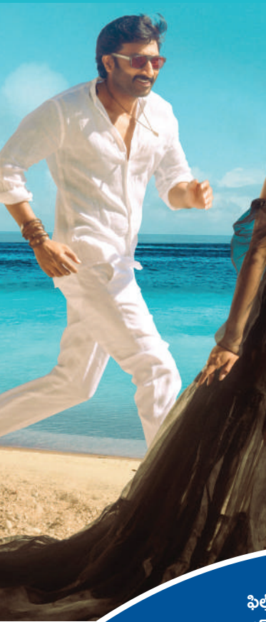
యాక్షన్ థియేటర్లకు తెరకెక్కిస్తున్న సైనికానిమ్ 'అల్పా' భారీ యాక్షన్ ఎంటర్టైన్మెంట్గా తెరకెక్కుతోంది.