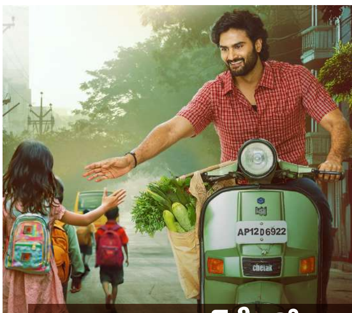
నాన్న సూపర్ హీరో' ఫస్ట్ లుక్ పోస్టర్ లిలీజ్