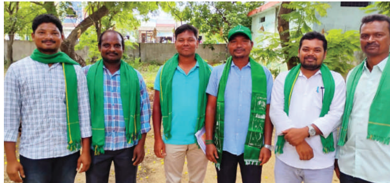
కాకుండా లీజర్ కాంట్రాక్ట్ సొసైటీని గిరిజనులకు ఉద్దేశ్యం ఉన్నట్లు గిరిజనులకు సభ్యత్వం ఇవ్వడమే కాకుండా, వారికి వారే పదవులను పొందినట్లుగా అమాయక గిరిజనులతో సంతకాలను చేపించుకొని అక్రమంగా

మణుగూడెం, విశాల భారతి: కొత్తగూడెం జిల్లా గిరిజనుల పేరిట ఇసుక తోలకాలకు అనుమతులు పొంది అక్రమాల చేయుటలో పేరు ఆరితేరినది విదితమే. ఈ అక్రమాలకు అధికారులు తోడు అయితే ఇక అప్పు అరుపు ఉండదు. మణుగూరు మండలం గోదావరి పరివాహక ప్రాంతం అయిన అన్నారం గ్రామం పేరుతో గిరిజనుల పేరిట షెడ్యూల్ ప్రాంత చట్టాలకు విరుద్ధంగా లీజర్ కాంట్రాక్ట్ మ్యూచువల్ ఎయిడెడ్ కో-పరేటివ్ సొసైటీ ఏర్పాటు చేసి ఇసుక రీచ్ అనుమతులను పొందారు. అసలు సొసైటీ ఫీ సిబిటి రిపోర్ట్ ప్రకారం కోపరేటివ్ శాఖకు చెందిన అధికారి సొసైటీ ఏర్పాటుకు సాధ్య సౌకర్యాలు లేవని నివేదిక ఇస్తే, అదే శాఖకు చెందిన అధికారులు అదే సొసైటీని రిజిస్టర్ చేశారు. అక్రమంగా చేసినదే