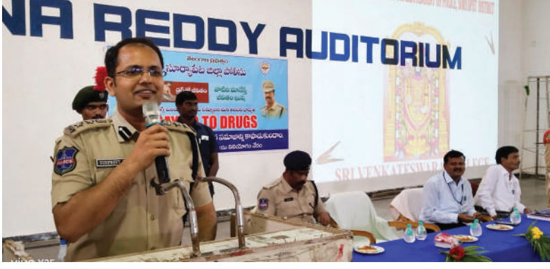
నిర్మూలన కోసం బాధ్యతగా ఉండాలని కోరారు. జిల్లా వ్యాప్తంగా అన్ని కళాశాలలో యాంటీ డ్రగ్స్