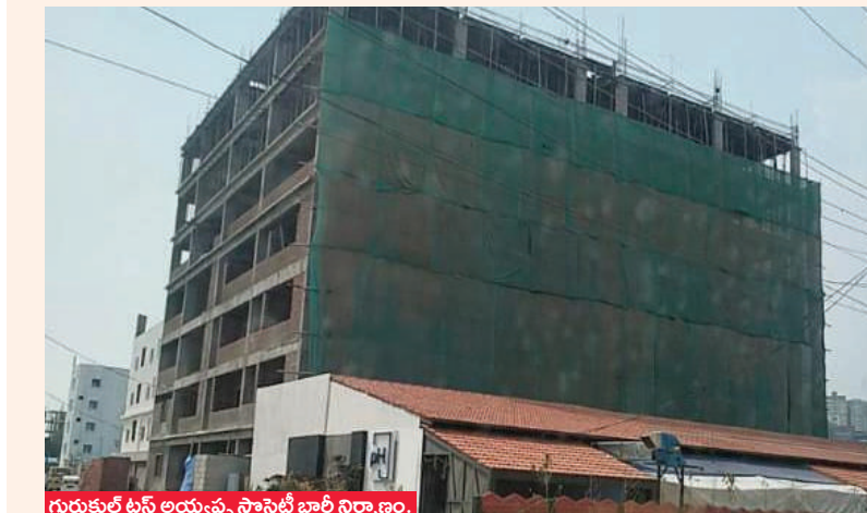
గురుకుల ట్రస్ట్ అయ్యప్ప సాస్టెట్ భారీ నిర్మాణం.

అనునగల్లు విశాలభారతి : కడ్రాల్ మండల కేంద్రంలో జాతీయ రూపారాజు చాకలి ఐలమ్మ 39వ వర్ధంతి వేడుకలు కడ్రాల్ రజక సంఘం ఆధ్వర్యంలో ఘనంగా నిర్వహించారు. ఐలమ్మ చిత్రపటానికి పూలమాలలు వేసి నివాళులర్పించారు. అనంతరం వర్ధంతి పండ్లను అందజేశారు.