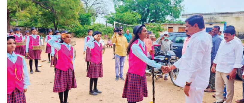
ప్రారంభించుకోవడం అభినందనీయుచున్నారు. ఇంట్లో పండుగ లాగా ఈ క్రీడోత్సవాలను జరుపడానికి కృషి