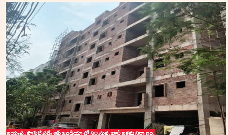
అయ్యప్ప సాస్టెట్ సర్వీస్ ఆఫ్ ఇండియా లో నిర్మిస్తున్న భారీ లక్షమ నిర్మాణం.