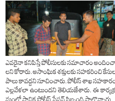
వైస్ చైర్మన్ కనిపిస్తే పోలీసులకు సమాచారం అందించాలని కోరారు. అసాధారణ కేసులకు సహకరించే కేసుల పాలు కాపడని సూచించారు. పోలీస్ శాఖ సహకారం ఎల్లవేళలా ఉంటుందని తెలియజేశారు. ఈ కార్యక్రమంలో స్థానిక పోలీస్ స్టేషన్ సిబ్బంది పాల్గొన్నారు.