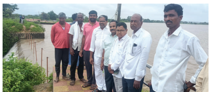
గంగమ్మ తల్లికి ప్రత్యేక పూజలు నిర్వహించిన గ్రామస్థులు

ధర్మశ్రీ విశాల భారతి: ధర్మశ్రీ మండల కేంద్రంలో గత రెండు మూడు రోజులుగా ఎడతెలిపి లేకుండా కురుస్తున్న వర్షాల వల్ల గంగమ్మ తల్లికి ప్రత్యేక పూజలు నిర్వహించామని, ఇలా చెరువులు నిండడం వల్ల ప్రజలకు ఎలాంటి దోహద లేదని ప్రజలు ఆనందం వ్యక్తం చేస్తున్నారని ఆయన అన్నారు. బిజెపి నాయకుడు జీర్ణ మహిపాల్ మాట్లాడుతూ... వర్షాలు అధికంగా