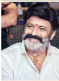
నాన్నగారు నా నుదుటిని దిద్దిన తిలకం ఇంకా మెరుస్తూనే ఉంది.. 50 ఏళ్ల నుంచి నా నట ప్రస్థానం సాగుతూనే ఉంది.. తెలుగు భాష అశీమ్యలతో, తెలుగుజాతి అభిమాన

సిరాజులతో పెనవేసుకున్న బందం ఇది.. ఈ బుజుల తీరనిది. ఈ జన్మ మీకోసం.. మీ ఆనందం కోసం.. నా ఈ ప్రయాణంలో సహకరించిన అందరికీ కృతజ్ఞతలు తెలియజేసుకుంటున్నాను. ప్రస్తుతం తెలుగు నేలను వరద ముంచెత్తుతోంది. ఈ విపత్కర పరిస్థితులలో బాధాభక్త పుష్కలయంతో ఆంధ్ర ప్రదేశ్ ముఖ్యమంత్రి సహాయ నిధికి రూ.50 లక్షలు, తెలంగాణ ముఖ్యమంత్రి సహాయ నిధికి రూ.50 లక్షలు నా బాధ్యతగా బాధితులకు ప్రజల సహాయార్థం విరాళంగా అందిస్తున్నాను. రెండు రాష్ట్రాలలో మళ్ళీ అతి త్వరలోనే సాధారణ పరిస్థితులు నెలకొనాలని ఆ భగవంతుడిని ప్రార్థిస్తున్నాను.