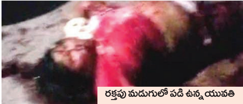
రక్తపు మడుగులో పడి ఉన్న యువతి