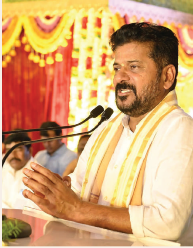
విశాలభారతి, నేషనల్ బ్యూరో:

హైదరాబాద్ లో కొనసాగుతున్న హైద్రా కూల్చివేతల పరంపరపై ముఖ్యమంత్రి రేవంత్ రెడ్డి కీలక వ్యాఖ్యలు చేశారు. శ్రీకృష్ణుడి భగవద్దీత స్వార్థిగానే హైదరాబాద్ లో కూల్చివేతలు చేపడుతున్నామని రేవంత్ రెడ్డి చెప్పారు. అధర్మం ఓడాలంటే యుద్ధం తప్పదని చాటిన కృష్ణుడి మాటలే తనకు స్ఫూర్తి అని రేవంత్ చెప్పారు. హైదరాబాద్ లో కొనసాగుతున్న హైద్రా కూల్చివేతల పరంపరపై ముఖ్యమంత్రి రేవంత్ రెడ్డి కీలక వ్యాఖ్యలు చేశారు. శ్రీకృష్ణుడి భగవద్దీత స్వార్థిగానే హైదరాబాద్ లో కూల్చివేతలు చేపడుతున్నామని రేవంత్ రెడ్డి చెప్పారు. అధర్మం ఓడాలంటే యుద్ధం తప్పదని చాటిన కృష్ణుడి మాటలే తనకు స్ఫూర్తి అని రేవంత్ చెప్పారు. హైద్రా కూల్చివేతల పరంపరపై ముఖ్యమంత్రి రేవంత్ రెడ్డి పాల్గొన్నారు.