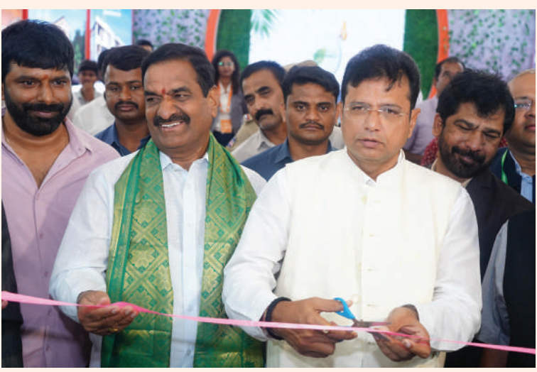
ఫోర్ట్ సిటీ వయా ఈస్ట్ సిటీ ..మిగతా 3 లో