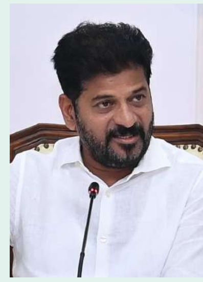
విశాలభారతి స్టేట్ బ్యూరో: