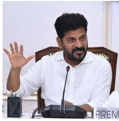
పెదతామని ముఖ్యమంత్రి వెల్లడించారు. తెలంగాణ యంగ్ ఇండియాకు ట్రాండ్ గా మారాలని ముఖ్యమంత్రి ఆకాంక్షించారు. క్రీడా వైపునాలో తెలంగాణ ఒక శక్తివంతమైన రాష్ట్రంగా గుర్తింపు పొందడానికి అవసరమైన అన్ని ఏర్పాట్లు చేయాలని ముఖ్యమంత్రి అధికారులను ఆదేశించారు.

శిక్షణ ఇచ్చి, ప్రతిభ ఆధారంగా వారికి స్పోర్ట్స్ యూనివర్సిటీలో పసతి కల్పించి మరింత పదును తెలేలా శిక్షణ ఇప్పించాలన్నారు.. హైదరాబాద్ లోని స్పోర్ట్స్ యూనివర్సిటీ దేశా క్రీడా రంగానికి కేంద్ర బిందువుగా ఉండాలని, అందుకోసం అవసరమైన అన్ని చర్యలు తీసుకోవాలని ముఖ్యమంత్రి అధికారులను ఆదేశించారు. ఇటీవల ఒలింపిక్స్ లో పతకాలు సాధించిన దేశాలు, క్రీడాకారుల వివరాలను సేకరించి, ఆయా క్రీడాకారుల పతకాల సాధనకు శ్రమించిన తీరు, ఆయా దేశాలు వారిని ప్రోత్సహించిన తీరు, వారికి ఇచ్చిన శిక్షణ, ప్రోత్సాహం తదితరాలపై అధ్యయనం చేసి సమగ్ర నివేదిక రూపొందించాలని ముఖ్యమంత్రి అధికారులకు సూచించారు. ఇప్పటికే స్పోర్ట్స్ యూనివర్సిటీకి యంగ్ ఇండియా పేరు పెట్టామని, స్పోర్ట్స్ యూనివర్సిటీ యంగ్ ఇండియా పేరు ఖరారు చేశామన్నారు. రాష్ట్ర వ్యాప్తంగా ఏర్పాటు చేస్తున్న ఇంటిగ్రేటెడ్ స్కూల్స్ కు యంగ్ ఇండియా పేరు