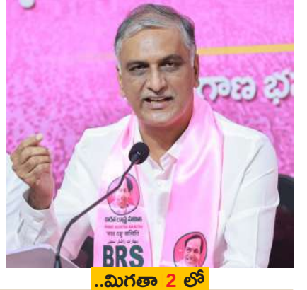
..మిగతా 2 లో