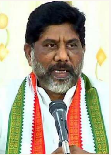
విశాలభారతి స్టేట్ బ్యూరో:

సచివాలయంలో ఎస్సీ, ఎస్టీ, బీసీ, మైనార్టీ గురుకులాల ఉన్నతాధికారులతో భట్టి విక్రమార్క, మంత్రి పాన్సం ప్రభాకర్ సమీక్ష నిర్వహించారు. ఎస్సీ, ఎస్టీ, బీసీ, మైనార్టీ గురుకుల పాఠశాలల్లో ఈ విద్యాసంస్థల పందతాతం అడ్డిపను పూర్తి చేయాలని భట్టి విక్రమార్క తెలిపారు. ప్రభుత్వ హాస్టళ్లు, గురుకులాల్లో చదువుతున్న ప్రతీ విద్యార్థి మంచంపైనే పడుకునేలా చర్యలు తీసుకోవాలని, వెంటనే నిధులు మంజూరు చేసేందుకు సిద్ధంగా ఉన్నామని ఉపముఖ్యమంత్రి అదేశించారు.