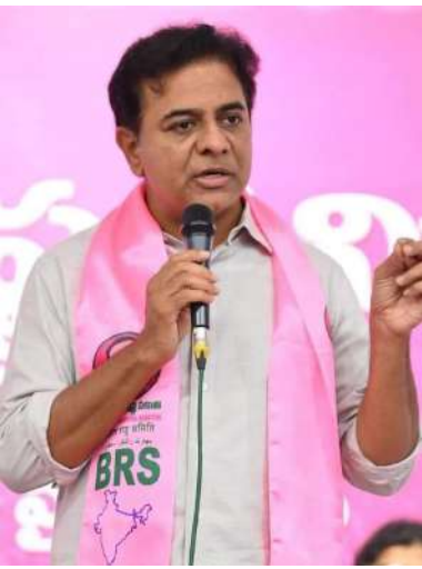
అమరవీరుల త్యాగాలను అవమానపరిచేలా రాజీవ్ గాంధీ విగ్రహం పెడుతున్న కాంగ్రెస్ పార్టీ తీరు మార్చుకోవాలని డిమాండ్ చేశారు. తెలంగాణ తల్లి విగ్రహానికి అవమానం జరిగితే ఊరుకోం. సచివాలయంలో రాజీవ్ గాంధీ విగ్రహం ఏర్పాటు చేయొద్దు. రాజీవ్ విగ్రహం ఏర్పాటు చేస్తే, అధికారంలోకి వచ్చాక తొలగిస్తాం. శంషాబద్ విమానాశ్రయానికి కూడా రాజీవ్ పేరు తొలగిస్తామని కేటీఆర్ అన్నారు.

విగ్రహాన్ని పక్కకు పెట్టి, రాజీవ్ గాంధీ విగ్రహాన్ని పెడుతారని మండిపడ్డారు. ముఖ్యమంత్రి రేవంత్ రెడ్డి జై తెలంగాణ అనరసి, అతి పెద్ద అంబేద్కర్ కనీసం పూలదండ వేయరని, అమరజ్యోతిలోకి ఇప్పటి వరకు సంరక్షకులను అనుమతించ లేదని అక్షేపించారు. తెలంగాణ బిడ్డ అలజయ్యను అవమానించిన రాజీవ్ గాంధీ విగ్రహం పెడుతున్నారని, ఆయనకు తెలంగాణతో ఏం సంబంధమని కేటీఆర్ ప్రశ్నించారు. గత పదేళ్లలో తాము ఏనాడూ పేర్ల మార్పుపై ఆలోచించలేదన్న ఆయన, కాంగ్రెస్ పార్టీ పెడుతున్న రాజీవ్ గాంధీ విగ్రహాన్ని అధికారంలోకి రాగానే అక్కడి నుంచి తరలిస్తామని చెప్పారు. రాజుల గాంధీ దగ్గర మార్పులు కొట్టేయాలనుకుంటే గాంధీ భవన్ లో చివర రేవంత్ రెడ్డి ఇంట్లో రాజీవ్ గాంధీ విగ్రహం పెట్టుకోవాలని సూచించారు. నాలుగేళ్లలో తెలంగాణలో కేటీఆర్ నాయకత్వంలో బీఆర్ఎస్ ప్రభుత్వం వస్తుంది, రాజీవ్ గాంధీ విగ్రహాన్ని ప్రకల మరూడలతో తొలగించి, కాంగ్రెస్ పార్టీ కోర్సును చోటికి పంపిస్తామని అన్నారు. ఇవాళ తెలంగాణ తల్లికి కాంగ్రెస్ పార్టీ చేసిన అవమానాన్ని మరచిపోలేమని వ్యాఖ్యానించారు. ఇతర రాష్ట్రాల్లో ఉన్నట్లుగానే తెలంగాణ ముమ్మడి యుడి పేరును అంతర్జాతీయ విమానాశ్రయానికి పెడతామని కేటీఆర్ చెప్పారు. తెలంగాణ ఆత్మగౌరవం,