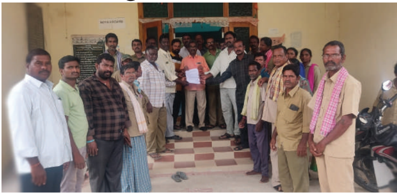
51ని సవరించి మల్టీపర్సన్ పర్మన్ విధానాన్ని రద్దు చేయాలని, ప్రభుత్వం కార్యకుల వేతనాలకు ప్రత్యేక