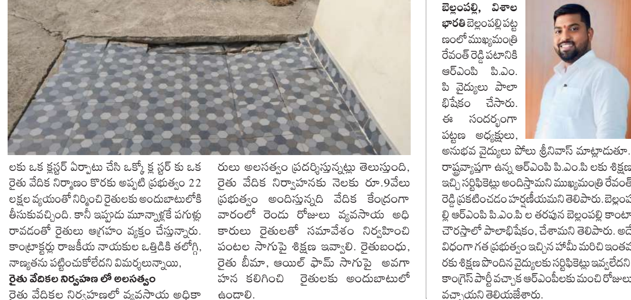
రైతు వేదికల నిర్వహణలో అలసత్వం

రైతు వేదిక నిర్మాణం కొరకు అప్పటి ప్రభుత్వం 22 లక్షల వ్యయంతో నిర్మించి రైతులకు అందుబాటులోకి తీసుకువచ్చింది. కానీ ఇప్పుడు మూన్యాక్షేప గ్రామంలో రావడంతో రైతులు అగ్రహం వ్యక్తం చేస్తున్నారు. కాంట్రాక్టర్లు రాజకీయ నాయకుల ఒత్తిడికి తలొగ్గి, నాణ్యతను పట్టించుకోలేదని విమర్శలు ఉన్నాయి. రైతు వేదికల నిర్వహణలో అలసత్వం రైతు వేదికల నిర్వహణలో వ్యవసాయ అధికారులు అలసత్వం ప్రదర్శిస్తున్నట్లు తెలుస్తుంది.