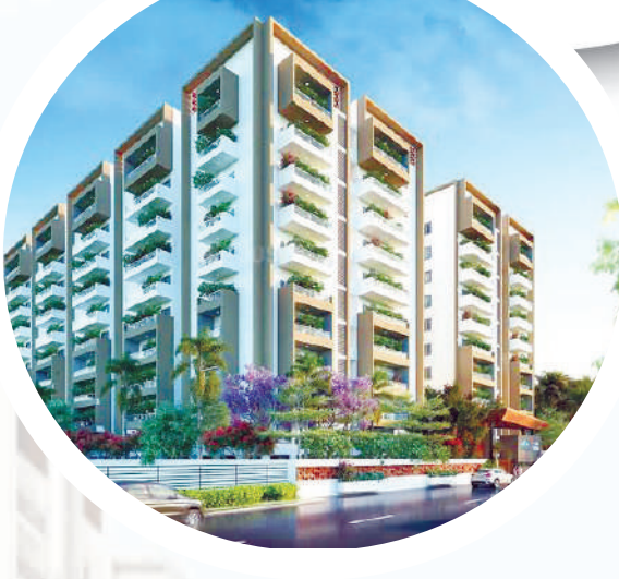
విశాలభారతి, హైదరాబాద్ :

గ్రేటర్ హైదరాబాద్ నగరం నలువైపులా విస్తరిస్తుంది. గడచిన రెండు దశాబ్దాలుగా వెస్ట్ జోన్ లో అనూహ్య రీతిలో అభివృద్ధి చెందిన రియల్ ఎస్టేట్ ఇప్పుడు ఈస్ట్ జోన్ వైపు చూస్తోంది. 'లుక్ ఈస్ట్' పేరుతో ప్రభుత్వం చూపుతున్న చొరవ రియల్ సంస్థలు దృష్టి సారించాయి. ఇప్పటికే పెరిగిన రోడ్ కనెక్టివిటీకి తోడు ఎయిర్ పోర్టు మెట్రో అలైన్మెంట్ ఎల్వీ నగర్ కేంద్రంగా విస్తరించడం ఈస్ట్ సిటీకి అత్యంత అనుకూలంగా మారాయి. ఈ కారణంగా స్థిరాస్తి పెట్టుబడులకు గ్రేటర్ ఈస్ట్ జోన్ మంచి సెంటర్ అవుతోందంటున్నారు. ప్రస్తుతం నగరంలో పెరిగిన ఇండ్ల ధరలతో సామాన్యుడి కలలు మరింత ప్రియంగా మారుతున్నాయి. లుక్ ఈస్ట్ విధానంతో సామాన్యుడికి అందుబాటులో ఉండే ధరలు సొంతింటి కల సాకారమయ్యే ఆస్కారం ఉంటుందని నిపుణులు చెబుతున్నారు.