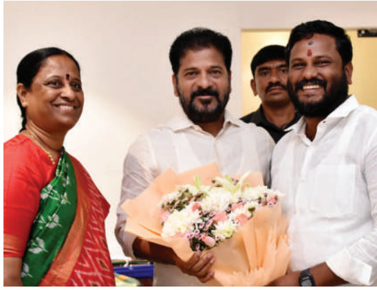
ఓటమికి సంబంధించిన కారణాలను విశ్లేషణ చేసుకొని సమన్వయంతో ముందుకు వెళ్తూ ప్రజా పాలనలో ప్రజల మధ్య ఉండాలని కోరారు. మెడకే పార్లమెంట్ పరిధిలో కాంగ్రెస్ పార్టీ కోసం పని చేసిన నాయకులకు, కార్యకర్తలకు, కాంగ్రెస్ పార్టీకి ఓటు వేసిన ప్రజలందరికీ ముఖ్యమంత్రి రేవంత్ రెడ్డి ధన్యవాదాలు తెలిపారు.

కార్యకర్తలు గెలుపు కోసం కష్టపడి పని చేశారని, బీఆర్ఎస్ బీజేపీతో కుమ్మక్క అవ్వడంతో మెడకే చేజారిందని చెప్పారు. ఓడిపోయామనే బాధపడకుండా ప్రజలకు అందుబాటులో ఉండి సేవలందించాలని సీఎం సూచించారు. పార్లమెంట్ ఫలితాలు వెలువడిన సందర్భంగా మెడకే పార్లమెంట్ కాంగ్రెస్ పార్టీ అభ్యర్థి నీలం మధుకు ముదిరాజ్ మంత్రి కొండా సురేఖతో కలిసి ముఖ్యమంత్రి రేవంత్ రెడ్డిని మర్యాద పూర్వకంగా కలిశారు. ఈ సందర్భంగా ఓటమి పట్ల బెంగ వదలమని అవసరం లేదని ముఖ్యమంత్రి రేవంత్ రెడ్డి నీలం మధుకు దైర్ఘ్యం ఇచ్చారు. మెడకే పార్లమెంట్ పరిధిలో కాంగ్రెస్ పార్టీ నాయకులు కార్యకర్తలు చెమటోడ్చి కష్టపడ్డారని, త్వరితగతినే విజయం చేజారిందని తెలిపారు.