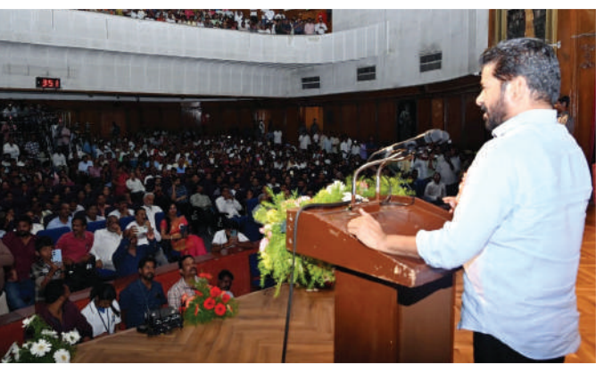
మారుమూల ప్రాంతాల్లోనూ మెరుగైన విద్యనుందించడమే మా ప్రభుత్వ లక్ష్యం"

ఎక్కువగా ఉన్న పరిస్థితి. ఇలాంటి పరిస్థితులన్నింటినీ దృష్టిలో ఉంచుకొనే తక్షణమే 11వేల పైచీలుకు పోస్టులతో మోగి దీవెనలు పంపాలని కోరారు. సింగిల్ టీచర్ బడుల్ని మూసేయడానికి వీలేదని, తండాలు, గూడేలో, మారుమూల ప్రాంతాల్లో ప్రభుత్వ బడులను నిర్వహించడం ద్వారా పేదలు, దళితులు, గిరిజనులకు విద్యను అందుబాటులోకి తీసుకురావాలన్న సంకల్పంతో ప్రజా ప్రభుత్వం పనిచేస్తోంది.