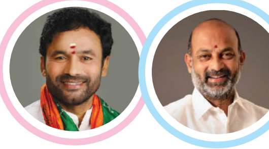
కిషన్ రెడ్డి, బండి సంజయ్ హాజరై ప్రమాణ స్వీకార కార్యక్రమానికి వెళ్తున్నారు. 2019లో తొలిసారి పార్లమెంట్కు ఎన్నికైన ఆయన

మంత్రులుగా ప్రమాణ స్వీకారం చేయాలంటూ ఇద్దరి నేతలకు ఉదయం పీఎంవో నుంచి ఫోన్ కాల్ వచ్చింది. దీంతో కాసేపటి క్రితం ఢిల్లీలోని కిషన్ రెడ్డి నివాసం నుంచి బండి సంజయ్ ఒకే కారులో ప్రధాని నివాసానికి బయలుదేరారు. ముందుగా అక్కడ జరిగే తేనేటి విందుకు