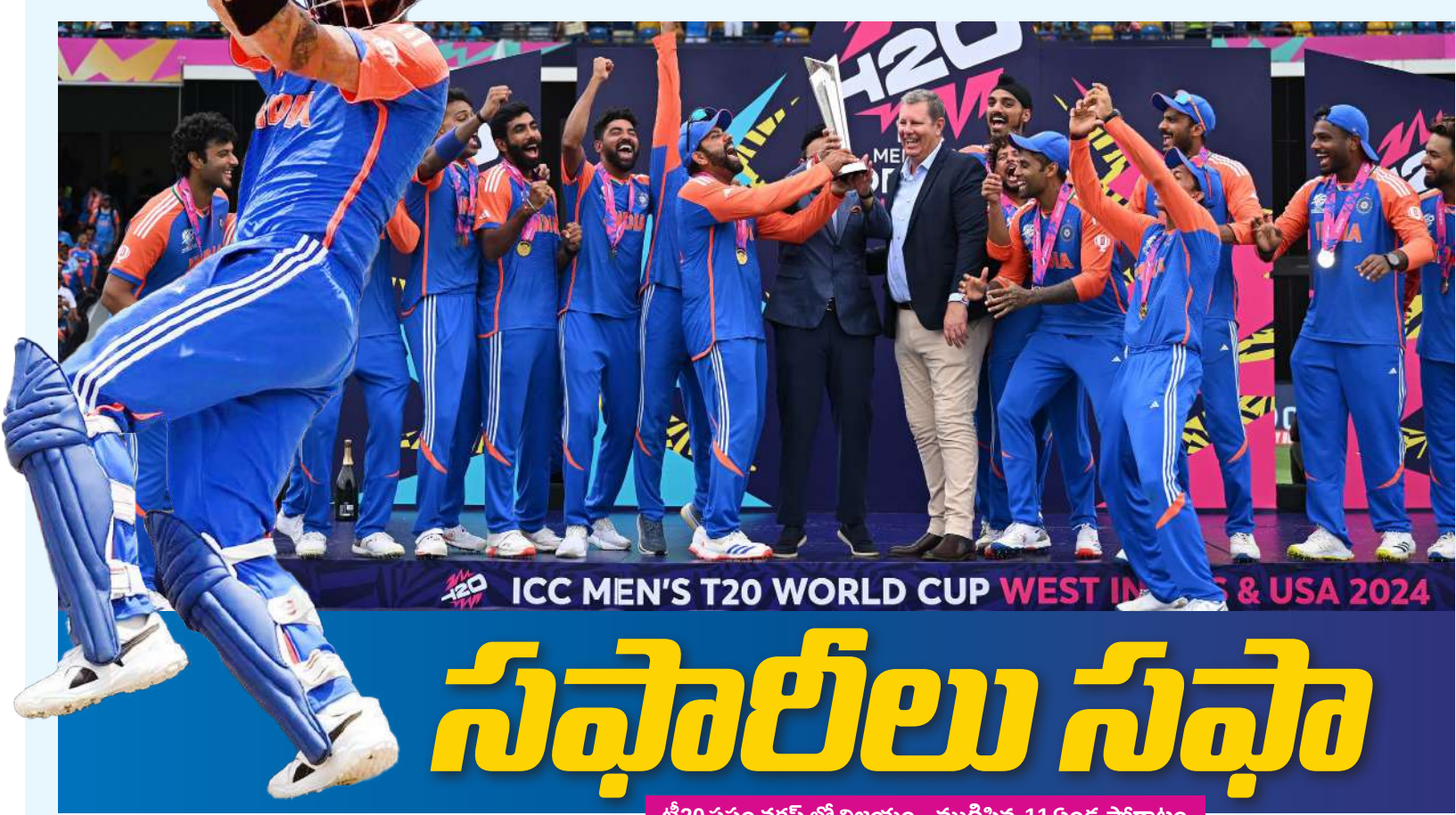
ICC MEN'S T20 WORLD CUP WEST INDIES & USA 2024