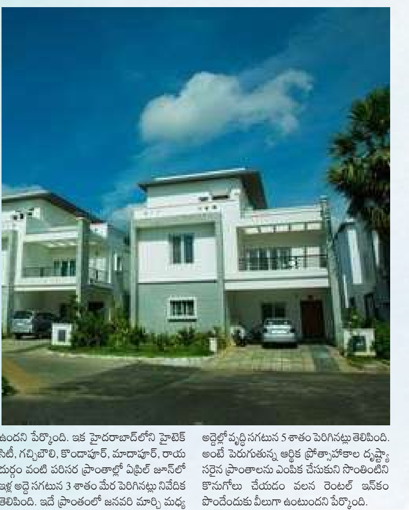
ఉందని పేర్కొంది. ఇక హైదరాబాద్లోని హైటెక్ సిటీ, గచ్చిబౌలి, కొండాపూర్, మాచాపూర్, రాయ దుర్గం వంటి పరిసర ప్రాంతాల్లో ఏటా జూనియర్ అళ్లె అద్దె సగటున 3 శాతం మేర పెరిగిస్తున్న నివేదిక తెలిపింది. ఇదే ప్రాంతంలో జనవరి మార్చి మధ్య అద్దెలో వృద్ధి సగటున 5 శాతం పెరిగిస్తున్నట్లు తెలిపింది. అంటే పెరుగుతున్న ఆర్థిక ప్రోత్సాహకాల దృష్ట్యా సరైన ప్రాంతాలను ఎంపిక చేసుకుని సొంతింటిని కొనుగోలు చేయడం వలన రెంటల్ ఇన్వెస్ట్ మెంట్ చేసేందుకు వీలుగా ఉంటుందని పేర్కొంది.

రూ. 50లక్షల పైనే... రూ. 50లక్షల లోపు ఇండ్లు ఇప్పుడు సర్వసాధారణంగా మారిపోయాయి. ఈ తరహా ఇండర్ అఫర్టువల్ రేంజీగా పరిగణిస్తున్నారు. పెరుగుతున్న ఆదరణ ఉన్నప్పటికీ వీటి లభ్యత ఏమాత్రం తగ్గడం లేదు. కానీ లగ్జరీ యూనిట్లను పరిమితంగా నిర్మించడంతో అమ్మకాలు వేగంగా పూర్తి అవుతున్నాయి. దీంతో లగ్జరీ ప్రాజెక్టుల ఆదరణ సహజంగా ఏర్పడుతుంది. ఇందులో ఎక్కువగా రూ. 80లక్షల పైనే ఉండే ప్రీమియం ఇండర్ ఇల్లు క్రమంగా పెంచుతుండటంతో ఈ తరహా యూనిట్లకు డిమాండ్ను పెంచుతుంది. ఇక కరోనా తర్వాత వర్క్ ఫ్రం హోం విధానం అనివార్యం కావడంతో ఇంటిలోనూ ఆఫీస్ స్పేస్ కూడా తప్పనిసరిగా మారింది. దీంతో కొనుగోలుదారులు తప్పనిసరిగా ఇంటిలోనే ఆఫీసుకు అనువుగా ఉండేలా చూసుకుంటున్నారు. బడ్జెట్ ఇండర్లో ఈ తరహా సదుపాయాలకు అవకాశం లేకపోవడంతోనే ఈ తరహాలో విశాలమైన ఇండర్ కొనుగోలు చేస్తున్నారు. దీంతో రూ. 80లక్షల దాటిన సొంతింటిని కొనుగోలు చేసే వారి సంఖ్య మెట్రో నగరాల్లో ఎక్కువగా ఉందని మార్కెట్ వర్గాలు చెబుతున్నాయి. విస్తీర్ణంలోని డబ్బూ బెహ్రాం ఫ్లాట్ పెరుగుదల దేశంలోని ప్రధాన మెట్రో నగరాల్లో ఢిల్లీ ఎన్సీఆర్, ముంబై, మెట్రోపాలిటన్ రీజియన్, కోల్ కతా, చెన్నై, హైదరాబాద్, ఫణే, బెంగళూరులో మధ్యస్థాయిలో