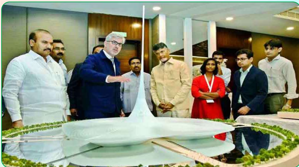
విశాలభారతి, హైదరాబాద్ :

చంద్రబాబు రాకతో చర్చనీయాంశంగా మారిన సిటీ రియల్టీ మహానగరంలో ధరలు పడిపోతాయంటూ జోరుగా చర్చలు అమరావతి రాజధానికి అనుకూలంగా రియల్ ఎస్టేట్ నివేదికలు