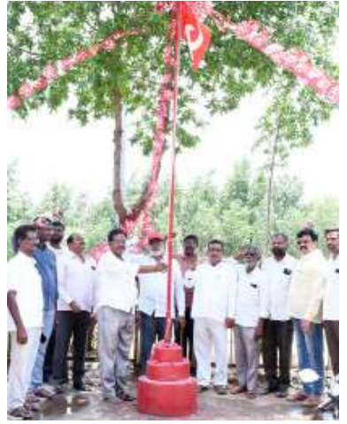
పేదల హక్కుల కోసం ఎన్నో పోరాటాలు నిర్వహించి మన హక్కులను సాధించాలని స్వాతంత్ర్యం రాకకూర్చు తెచ్చుకున్నటువంటి చట్టాలను కేంద్ర ప్రభుత్వం హరించిన సందర్భంగా 29 కార్మికుల నాలుగు నాలుగు కోట్ల గా మార్చిన వివాదానికైనా 1038 సంవత్సరాల కింద పోరాటం చేసినటువంటి మా చట్టాలను మేము మళ్ళీ తిరిగి తెచ్చుకుంటామని కేంద్ర ప్రభుత్వాన్ని హెచ్చరించారు.

చౌటుప్పల్, విశాలభారతి: మున్సిపల్ కేంద్రంలో సిబిటియూ ఆవిర్భావ దినోత్సవం సందర్భంగా పరిశ్రమలు, కార్యాలయాల ఎదుట జండా ఆవిష్కరణలు చేశారు. ఈ సందర్భంగా కార్మికులు పనులకు వెళ్ళకుండా భోజనాలు ఏర్పాటు చేసుకొని ఒక దగ్గర కూర్చుని సమావేశాలు చేసుకున్నారు. ఈ సందర్భంగా సిబిటియూ ఉపాధ్యక్షులు ఎం.డి.పా.పా. మాట్లాడుతూ భారత దేశంలో 1970లో మే 30వ తేదీ నాడు కలకత్తాలో సిబిటియూ ఏర్పడ్డది అనాటి నుండి ఈనాటి వరకు మొత్తం ఏ ఏకైక ముందుకు సాగుతూ కార్మికుల హక్కుల కోసం సమరశీల పోరాటాలు నిర్వహిస్తూ దేశవ్యాప్తంగా కార్మికుల పక్షాన నిలబడి పనిచేస్తూ పెద్దన్న పాత్ర పోషిస్తూ ఉన్నది 10 సంవత్సరాల కాలంలో కేంద్ర ప్రభుత్వం తీసుకువచ్చిన సబ్ చట్టాలతో పాటు కార్మికుల చట్టాలు కుదిరిన రైతు వ్యతిరేక చట్టాల కోసం కరెంటు చట్టాన్ని కుదిరించే సందర్భంలో కార్మికుల కర్షక వర్గానికి పెద్దన్న పాత్ర పోషించి ముందుకు సాగినటువంటి ఘనత సిబిటియూకు దక్కింది అని అభివృద్ధి పేద పేదల హక్కులు ఎక్కడైతే హరించే చేస్తున్నారు. అప్పుడే ఎంత పెద్ద పోరాటానికైనా సదుదు బిగించి ముందుకు సాగుతుందని సిబిటియూలో విన్న సభ్యులు రాబోయే కాలంలో తమ హక్కుల కోసం