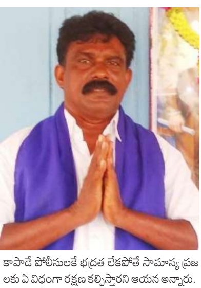
కాపాడి పోలీసులతో భద్రత లేకపోతే సామాన్య ప్రజలకు విధిగా రక్షణ కల్పిస్తారని ఆయన అన్నారు.