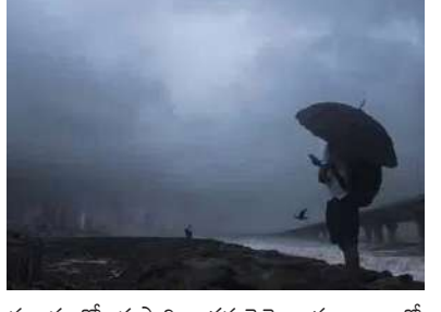
ప్రభుత్వం ఈసారి ఆగస్టునెట్టెంబరు కాలంలో సాధారణం కంటే అధిక వర్షపాతం సమాధు కావచ్చని సేర్పాటు చేసింది.

మొదటిసారి తరువాయి పోలిస్ వచ్చే రుతుపవనాల సీజన్లో 106 శాతం వర్ష పాతం సమాధు కావచ్చని తెలిసింది.