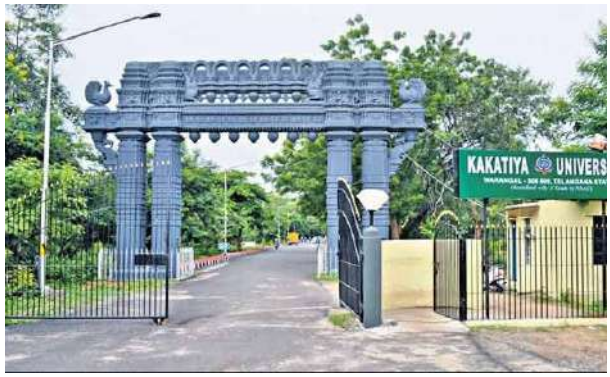
కొలేదని భూకట్టాదారులకు అండగా నిలుస్తున్నారని ఫిర్యాదులో టీచర్ల సంఘం తెలిపింది.