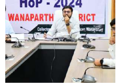
గ్రూప్ 1 ప్రిలిమినరీ అభ్యర్థులు