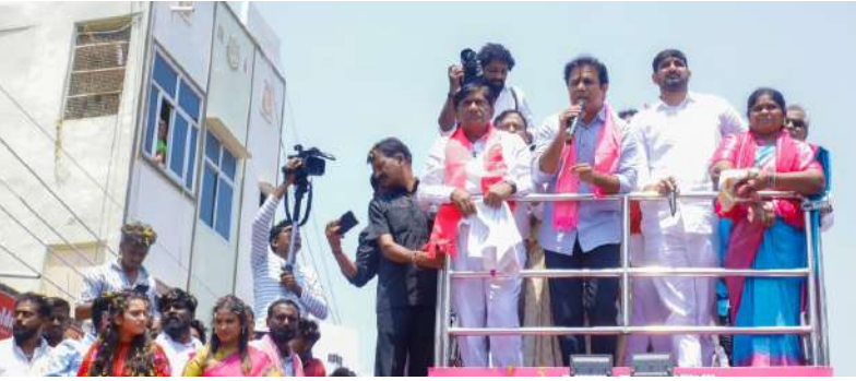
విశాలభారతి స్టేట్ బ్యూరో: