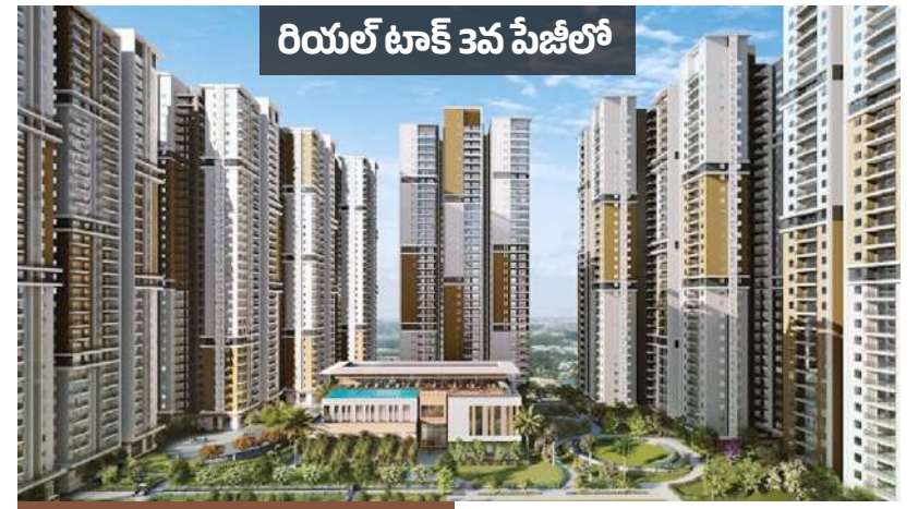
రియల్ టాక్ 3వ పేజీలో