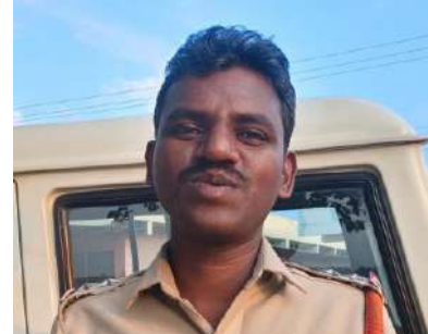
వేసుకోవచ్చునీ, పార్టీ గుర్తులు, కండువలు, టోపీలు ధరించి ఉండకూడదన్నారు. పై నిబంధనలు ఎవరైనా అతిక్రమించినచో చట్ట ప్రకారం క్రిమినల్ కేసులు నమోదు చేయబడతాయని ఎస్సీ తెలిపారు.

ఇండల్వాయి విశాల భారతి: ఇండల్వాయి మండల నాయకులకు, ప్రజలకు ముఖ్యంగా యువత ఎక్కువగా గుర్తుపట్టుకోవాల్సిన విషయం ఈ నెల 13 వ తేదీన పార్లమెంట్ ఎన్నికల ఉన్నందున ఎలక్షన్ కమిషన్ మార్గదర్శకాల ప్రకారం నిజామాబాద్ కమిషన్ ఆదేశాలను జారీ చేశారని ఎస్ఐ కుమార్ కుమార్ తెలిపారు. మే 11 న సాయంత్రం 6 గంటల నుండి మే 14 ఉదయం 6 వరకు 144 సెక్షన్ అమలులో ఉన్నందున 5 గురు అంత కంటే ఎక్కువగా వ్యక్తులు గుమిగూడి ఉండకూడదు అన్నారు. పోలింగ్ దే మే 13 నాడు ఎట్టి పరిస్థితుల్లోనూ ఏ పార్టీకి చెందిన వారైనా కూడా (200) రెండు మండల మీటర్ల లైన్ ఇయట్ల ఉండాలని అన్నారు. ఎక్కువ కూడా టెంట్లు వేయరాదు, ఓస్సీ ఒక టేబుల్ రెండు కుర్చీలు, గుడుగులు మాత్రమే