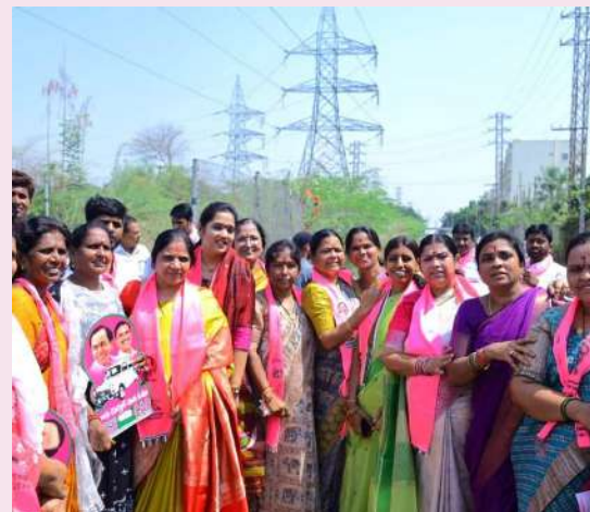
ప్రచారం నిర్వహించారు. బీఆర్ఎస్ కు అనుకూలంగా ప్రత్యర్థుల వైఫల్యాలు..