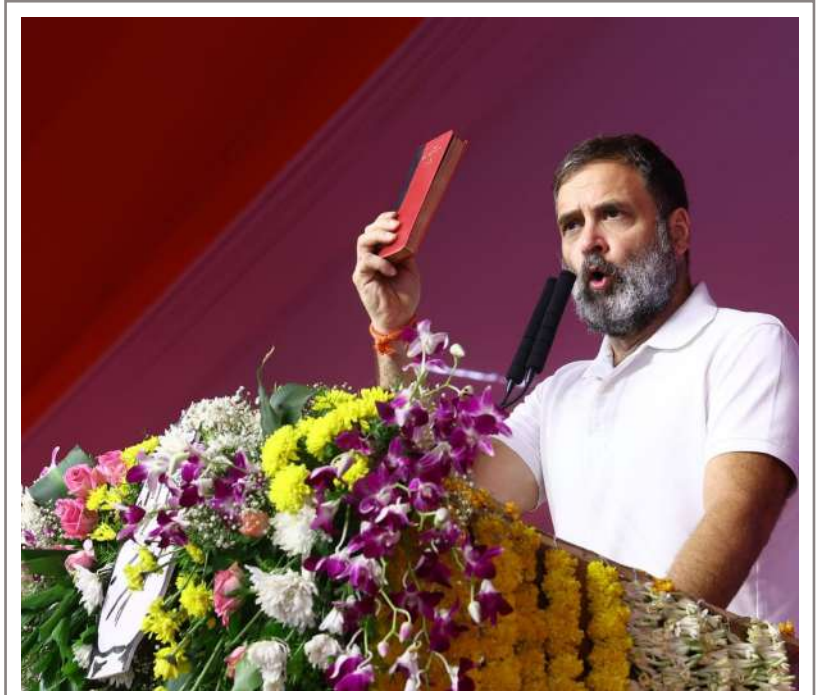
విశాలభారతి, నేషనల్ బ్యూరో:

ఈ దేశంలో రాజ్యాంగంతోనే పేదలకు బలమైన శక్తి వచ్చిందని కాంగ్రెస్ అగ్రనేత రాహుల్ గాంధీ అన్నారు. ఎన్నికల ప్రచారంలో భాగంగా మెదక్ జిల్లా నర్సాపూర్లో నిర్వహించిన కాంగ్రెస్ జనజాతర సభలో ఆయన ప్రసంగించారు. "గొప్ప మేధావులు ఏళ్ల తరబడి కృషి చేసి దేశానికి రాజ్యాంగం అందించారు. ఎంతో గొప్పదైన మన రాజ్యాంగాన్ని మారుస్తామని బీజేపీ నేతలు చెబుతున్నారు. దేశంలో 90శాతం ఉన్న ఎస్సీ, ఎస్టీ, బీసీలకు రాజ్యాధికారం దక్కటం లేదు. విద్య, ఉద్యోగాలు, ఓటు హక్కు అన్నీ మనకు రాజ్యాంగం ద్వారానే వచ్చాయి. దాంతో పాటు రిజర్వేషన్లు కూడా రద్దు చేయాలని బీజేపీ, ఆర్ఎస్ఎస్ కుట్ర చేస్తున్నాయి. రిజర్వేషన్లు రద్దు చేసే కుట్రలో భాగంగానే ప్రభుత్వ రంగ సంస్థలను విక్రయిస్తున్నారు. క్రమంగా అన్నింటినీ ప్రైవేటు పరం చేసి రిజర్వేషన్లు రద్దు చేయాలనేది భాజపా ఆలోచన. మోదీ పదేళ్లుగా విమానాశ్రయాలు, పోస్టలు, భారీ పరిశ్రమలు విక్రయించారు. భాజపా కుట్రలను అడ్డుకునేందుకు ఇండియా కూటమి శాశ్వతకూటా బొంబును విసిరింది. మోదీ పాలనలో కేవలం 2శాతం ఉన్న బిలియనీర్ల చేతిలోకి దేశ సంపద అంతా