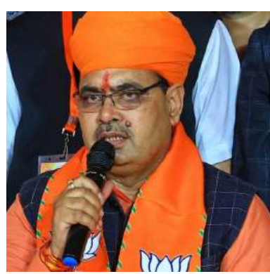
దం, నక్సలైజం, విభజనవాదం పెరగాడని కారణం కాంగ్రెస్ నునే దృఢపెట్టారు. జూన్ 4న కాంగ్రెస్ సహా విపక్ష కూటమి నేతలకు ఓటమి తప్పదని ఆయన కోసం చెప్పారు.