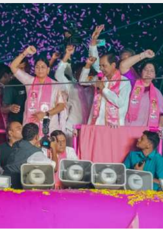
గిరిజనులను గౌరవించలేదని, బీఆర్ఎస్ హయాంలో సేవాలాల్ భవన్ నిర్మించామని తెలిపారు. ఈ ఎన్నికల్లో కాంగ్రెస్ పై గిరిజనులు ప్రతాపం చూపించాలని

ఆరు గ్యారంటీలతో రాష్ట్ర ప్రజలకు అరచేతిలో వైకుంఠం చూపిన కాంగ్రెస్ పార్టీ అధికారంలోకి వచ్చాక దగా చేస్తోందంటూ బీఆర్ఎస్ పార్టీ అధినేత, మాజీ ముఖ్యమంత్రి కేసీఆర్ విమర్శించారు. బీఆర్ఎస్ హామీలతో అధికార పీఠమెక్కి పథకాలను అమలు చేయకుండా తప్పించుకుంటోందని అన్నారు. లోక్ సభ ఎన్నికల ప్రచారంలో భాగంగా, ఇవాళ మహాభారతాబాది బీఆర్ఎస్ ఎంపీ అభ్యర్థి కత్తు మద్దతుగా కేసీఆర్ రోడ్ షో నిర్వహించారు. రాష్ట్ర ప్రజలకు ఇచ్చిన హామీలను ఏ ఒక్కరినీ సత్యంగా అమలు చేయడం లేదని దుయ్యబట్టారు. కొనుగోలు కేంద్రాలలో ధాన్యం కొనే దిక్కులేక రైతులు, తీవ్ర ఇబ్బందులు పడుతున్నారని వారి ఉసురుపోసుకుంటుందని విమర్శించారు. ఉచిత బస్సు ప్రయాణం వల్ల ఆరోగ్యకులు రోడ్డున పడ్డారని, ఆరోగ్యకులు అవాకొవాలని డిమాండ్ చేశారు. కాంగ్రెస్ పాలనలో