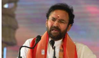
రేవంత్ కు లేదన్నారు. రేవంత్.. తెలంగాణ పౌరుషాన్ని కాంగ్రెస్ ఢిల్లీ బాసులకు తాకట్టు పెడుతున్నారని కేంద్ర మంత్రి కిషన్ రెడ్డి ఘాటుగా స్పందించారు. రేవంత్.. గుజరాత్ వరకు వెళ్లవసరం లేదని, ఆయనకు తాము చాలని, ముందు తమను దాటాలని సవాల్ చేశారు. టెలిఫోన్ ట్యాపింగ్, వీడియో ఎడిటింగ్ రెండు నేరాలైనవి, రానున్న లోక్ సభ ఎన్నికల్లో బీఆర్ఎస్, కాంగ్రెస్ ను పాతర వేయడం భాయమన్నారు. బీఆర్ఎస్ అవినీతిపై కాంగ్రెస్ మెత్త వైఖరితో ఉందని ఆయన పైరయ్యారు. రేవంత్ కాకము కథలు చెప్పి కాలం వెళ్లడేయిద్దని సూచించారు. కేంద్ర హోంశాఖ మంత్రి అమిత్ షా ఈనెల 5న మరోసారి రాష్ట్రానికి రానున్నట్లు కిషన్ రెడ్డి స్పష్టం చేశారు. 8న ప్రధాని నరేంద్ర మోడీ చర్యలు చేపట్టారు. వీరితో పాటు జాతీయ నేతలు కూడా తెలంగాణకు వస్తారన్నారు.

ఫేక్ వీడియో సృష్టిలో రేవంత్ రెడ్డి మొదటి ముద్దాయిని కేంద్ర మంత్రి కిషన్ రెడ్డి ఆరోపణలు చేశారు. న్యాయస్థానాల్లో దోషులను బోనులో నెలబెడతామని, ఫేక్ వీడియోల సృష్టిలో ఎవరి ప్రయోగం ఉన్నా జైలు ఊచలు లెక్కపెట్టక తప్పదని కిషన్ రెడ్డి హెచ్చరించారు. నాంపల్లి బీజేపీ రాష్ట్ర కార్యాలయంలో బుధవారం నిర్వహించిన మీడియా సమావేశంలో ఆయన మాట్లాడారు. సీఎం తీరు అందోళనకరంగా ఉందని ఆయన వద్దేవాచేశారు. సీఎం నిజస్వరూపం రోజూరోజూకూ బయటపడతోందని మండిపడ్డారు. నాలుగు నెలల్లో రేవంత్ ప్రతిష్ట ప్రజల్లో దిగజారిందని తెలిపారు. రేవంత్ అపరిపక్వంగా, అహంకారంగా వ్యవహరిస్తున్నారని, నిజానికి గాడిదలు గుడ్డు పెట్టవని, మరి భూ ప్రపంచంలో గాడిదలకు గుడ్డు ఎలా పుట్టిస్తారో అది రేవంత్ రెడ్డికి తెలుసని కిషన్ రెడ్డి సెటైర్లు చేశారు. తెలంగాణ ప్రజలకు తానేమీ చేయలేనని చెప్పేందుకే సీఎం రేవంత్ గాడిద గుడ్డును నెట్టిపై పెట్టుకొని మాట్లాడుతున్నారన్నారు. రేవంత్ మాట్లాడిందే.. మార్చింగ్ లో ఉందని, రేవంత్ వివాదాన్ని తెలంగాణ ఉద్యమం లో పాల్గొన్నా? అని ప్రశ్నించారు. టీడీపీలో ఉంటూ తెలంగాణ ఉద్యమానికి వ్యతిరేకంగా మాట్లాడడం మండిపడ్డారు. తెలంగాణ గురించి మాట్లాడే హక్కు