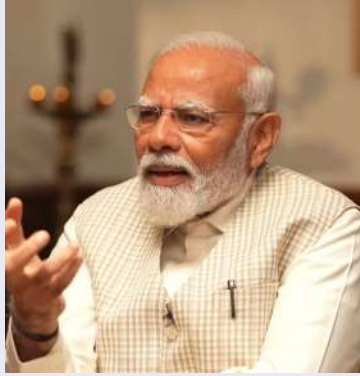
అవకాశాలున్నాయని నాయకులు చెబుతున్నారు. ఇదిలా ఉండగా తొలుత ఈనెల 3, 4 తేదీల్లో ప్రధాని మోడీ టూర్ కోసంగా పుట్టి ఉండగా అనివార్య కారణాల వల్ల వాయిదా పడింది.

ప్రధాని మోడీ ఈనెల 8, 10 తేదీల్లో తెలంగాణ పర్యటనకు వస్తున్నారు. పార్లమెంట్ ఎన్నికల్లో భాగంగా ఆ రెండ్రోజులు ప్రచారాన్ని హోరెత్తించ వున్నారు. ఈనెల 8న వేములవాడ, వరంగల్ లో ప్రధాని మోడీ ప్రచారం చేయనున్నారు. కరీంనగర్ బీజేపీ ఎంపీ అభ్యర్థి బండి సంజయ్, వరంగల్ బీజేపీ ఎంపీ అభ్యర్థి అరూరి రమేష్ తరుపున ఆయన ప్రచారంలో పాల్గొననున్నారు. అలాగే 10న మహబూబ్ నగర్, హైదరాబాద్ లోకే సభ సెగ్మెంట్ లో డీకే అరుణ, మార్గవీల తరుపున ప్రచారం చేయనున్నారు. హైదరాబాద్ లో ప్రధాని మోడీ రోడ్ షో నిర్వహించే అవకాశముందని తెలుస్తోంది. ఈనెల 13న ఎన్నికలు జరగనున్నాయి. ప్రధాని మోడీ రాష్ట్రం ప్రధాని మోడీ టూర్ కోసంగా పుట్టి ఉండగా అనివార్య కారణాల వల్ల వాయిదా పడింది.