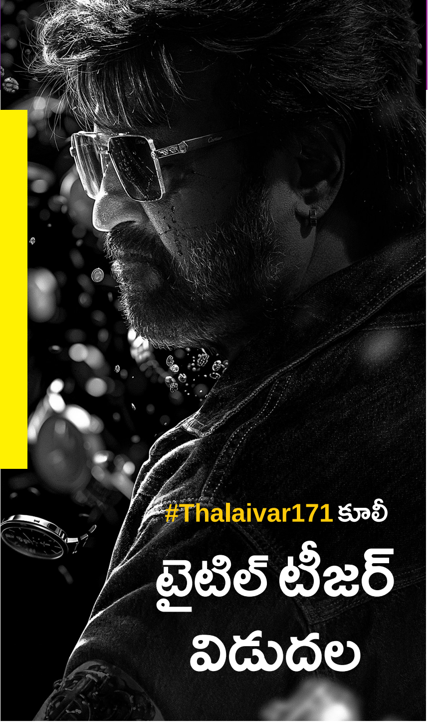
#Thalaivar171 కూలీ వైటిల్ టీజర్ విడుదల

జైలర్ మ్యాసీన్ సక్సెస్ తర్వాత సూపర్ స్టార్ రజనీకాంత్ తన 'LCU' తో వరుస బ్లాక్ బస్టర్లతో దూసుకుపోతున్న సంచలన దర్శకుడు లోకేష్ కనగరాజ్ తో చేతులు కలిపారు. సన్ పిక్చర్స్ నిర్మిస్తున్న చిత్రం #Thalaivar171 వనర్ ప్యాక్ టీజర్ ద్వారా బ్రేటిల్ లిటిల్ చేశారు ఈ చిత్రానికి 'కూలీ' అని పేరు పెట్టారు. టీజర్ సూపర్ స్టార్ రజనీకాంత్ ను స్టైలిష్, యాక్షన్-ప్యాక్ అవతారంలో ప్రజెంటే చేసింది. అతను గోల్డ్ స్టర్ గెట్ డెన్ లోకి ప్రవేశిస్తాడు. బంగారు గడియారాలతో చేసిన గొలుసుతో వాలిన్ తుక్కుగా కొండలాడు. ఆ తర్వాత స్ట్రెంగ్ మురా బాసిన ఫోన్ లో వార్నింగ్ ఇస్తాడు. సూపర్ స్టార్ కి ఇది లోకేష్ కనగరాజ్ మార్క్ ఇంటర్ డక్షన్. కూలీ పూర్తి యాక్షన్ తో నిండిపోతుందని, రజనీకాంత్ తన ఐంటిజి అవతారంలో కనిపిస్తారని టీజర్ హామీ ఇచ్చింది. అనిరుధ్ బ్యాక్ గ్రౌండ్ సాంగ్ అద్భుతంగా వుంది. 2025లో సినిమాను విడుదల చేసేందుకు మేకర్స్ ప్లాన్ చేస్తున్నారు.