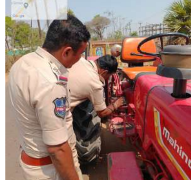
టీసుకుంటామని చెప్పారు మండల పరిధిలోని కొన్ని గ్రామాలు పర్యటించారు.