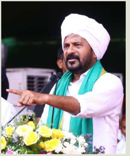
చాలని కోరారు. రాజీయే రోజుల్లో కేంద్రంలో కాపూల్ గాంధీ ప్రభుత్వం ఏర్పడుతుందని.. ఆ ప్రభుత్వంలో జీవన్ రెడ్డి వ్యవసాయ మంత్రి అవుతారని రేవంత్ రెడ్డి చెప్పారు. కాంగ్రెస్ అధిష్టానాన్ని ఓప్పించి మరీ మిగతా 2లో

నిజామాబాద్ లో ఎంపీ అభ్యుద్ధిగా ఉన్న జీవన్ రెడ్డిని బీజేపీ మోసపూరిత గెలిపించాలని ముఖ్యమంత్రి రేవంత్ రెడ్డి పిలుపు ఇచ్చారు. నిజామాబాద్ లో పెండింగ్ లో ఉన్న పనులన్నీ చేసే చూపి తనదే అని హామీ ఇచ్చారు. బోధన్ షుగర్ ఫ్యాక్టరీని కూడా త్వరలో తెరిపించే ప్రయత్నాలు జరుగుతున్నాయని అన్నారు. వీలైతే సెప్టెంబరు 17లోపు చక్కెర కర్పూరాలను తెరిపించే బాధ్యతను కాంగ్రెస్ పార్టీ తీసుకుంటుందని చెప్పారు. నిజామాబాద్ లో జరిగిన జనజాతర ఎన్నికల ప్రచార సభలో రేవంత్ రెడ్డి పాల్గొన్నారు. గతంలో 2014 ఎన్నికల సమయంలో కవిత ఎంపీగా ఎన్నికకాక ముందు పంద రోజుల్లో హామీలన్నీ నెరవేరుస్తామని చెప్పి చేయలేదని అన్నారు. అందుకే వైతన్యవంతం గల నిజామాబాద్ రైతులకు కవితను, ఆమె జెండాను 100 మీటర్లలోతులో పాతిపెట్టి.. 2024 ఎన్నికల్లో పోటీ చేసేందుకు కూడా భయపడే పరిస్థితికి తెచ్చారుని అన్నారు. వెనకటికి వెళ్లి తాతకు దగ్గు నేర్పినట్లుగా రైతులను మభ్యపెట్టటట్లుగా స్పెసిస్ బోర్డును పసుపు బోర్డుగా నమ్మబలుకుతున్నారని అన్నారు. నిజామాబాద్ రైతులకు అండగా వారి గళాన్ని పాఠశాలలో వినిపించడం కోసం జీవన్ రెడ్డిని గెలిపించ