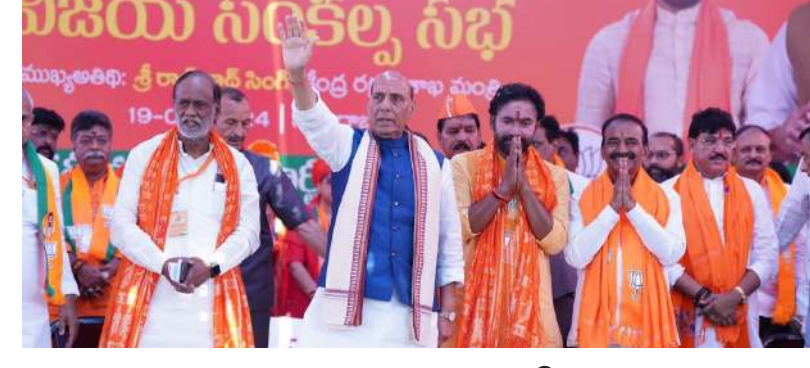
విజయ సంతకం సభ

రావడం విషక పార్టీకి ఇష్టం లేదని కాంగ్రెస్ పార్టీ ప్రధాని మోదీ విమర్శించారు. తమ ప్రభుత్వం పేదల సంక్షేమానికి కట్టుబడి ఉందని, ఈ క్రమంలోనే పేదలకు ఉచితంగా రేషన్ అందించే కార్యక్రమాన్ని మరో ఐదేళ్లు పొడిగించామన్నారు. దీనివల్ల రాహుల్ గాంధీ 80 కోట్ల మంది లబ్ధి పొందుతారని అన్నారు. రామజన్మభూమి బాబ్లీ మసీదు కేసులో కక్షిదారుగా ఉన్న ఇక్బాల్ అన్సారీపై ప్రధాని మోదీ ప్రశంసలు కురిపించారు. ఆయోధ్యలో రామమందిరం ప్రాణప్రతిష్ఠ కార్యక్రమం ఆహ్వానాన్ని ఆయన అంగీకరించడం గొప్ప విషయమన్నారు. అదే కాంగ్రెస్ పార్టీ ఆ కార్యక్రమానికి దూరంగా ఉండటంపై ప్రధాని మోదీ విమర్శలు గుప్పించారు.