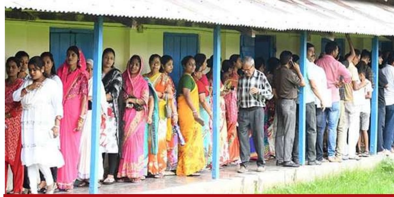
మా చేతుల్లో లేదు : సీఎం

మరోవైపు, తొలివిడత పోలింగ్ లో పలువురు ప్రముఖులు తమ ఓటు హక్కు వినియోగించుకున్నారు. తమిళనాడు గవర్నర్ ఆర్ఎన్ రవి తన సతీమణితో కలిసి వెళ్లి చెన్నైలో ఓటు వేశారు. సీఎం, డీఎంకే అధినేత సోనియాగాంధీ ఓటేసారు. మాజీ సీఎం, అన్నాడీఎంకే నేత పళనిశామీ సీలంలోని పోలింగ్ కేంద్రంలో ఓటు వేశారు. కాంగ్రెస్ సీనియర్ నేత, కేంద్ర మాజీ మంత్రి చిదంబరం శివంగిలో ఓటు వేశారు. తెలంగాణ మాజీ గవర్నర్, బీజేపీ దక్షిణ