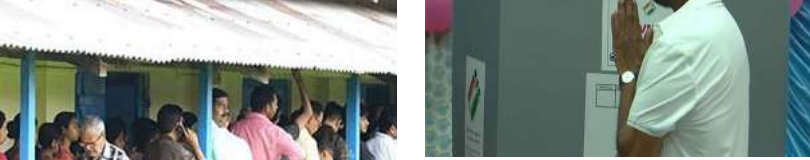
6 జిల్లాల్లో సున్నా శాతం పోలింగ్

తాజా పరిణామంపై నాగాలాండ్ ముఖ్యమంత్రి నియోఫయం రియా స్పందించారు. ప్రభుత్వానికి ఎటువంటి ఇబ్బంది లేదని.. ప్రెంటీయర్ నాగాలాండ్ టెలిఫోన్ ఫంక్షన్ (FNT) స్వయంప్రతిపత్తి కల్పించాలని ఇప్పటికే సభాపక్షం చేశామన్నారు. అయితే, 20 మంది ఎమ్మెల్యేలు ఓటు వేయకపోవడంతో టెలిఫోన్ ఫంక్షన్ కు సమస్య వచ్చింది. అలాగే, పలువురు సీసీ, రాజకీయ పరస్పరం ఫిర్యాదులు చేసుకున్నాయి. మరోవైపు, పత్తీన్ గాంధీ గ్రామ్ జరిగడంతో ఓ సీఆర్పీ ఎంపీ ఐజాన్ ప్రాణాళి కోల్పోయారు. అరుణాచలప్రదేశ్ లో, అసాం, అండమాన్ నికోబార్ దీవులు వంటి పలుచోట్ల ఈవిఎంలలో సాంతి కరమైన సమస్యలు తలెత్తడంతో పలుచోట్ల దాదాపు గంటల అలస్యం