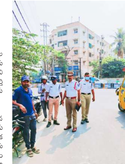
నిత్యం రద్దీగా ఉండే మియాపూర్ ప్రాంతంలో రోజుకు 50 మంది వాహనదారులు కేసులు నమోదు అవుతున్నారని పోలీసులు పేర్కొంటున్నారు.

ప్రభుత్వం 2017 ఏప్రిల్ 24న జీవో 26 విడుదల చేసింది. ఈ జీవో ప్రకారంగా ట్రాఫిక్ ఉల్లంఘనకు పాల్పడే వారికి జరిమానాలతో పాటు పాయింట్లు విధానాన్ని కొత్తగా ప్రవేశపెట్టింది. 12 పాయింట్లు పూర్తి అయితే వారి లైసెన్సు ఏడాది నుంచి మూడేళ్ల వరకు భ్రాకి లైసెన్సు పెడతారు.