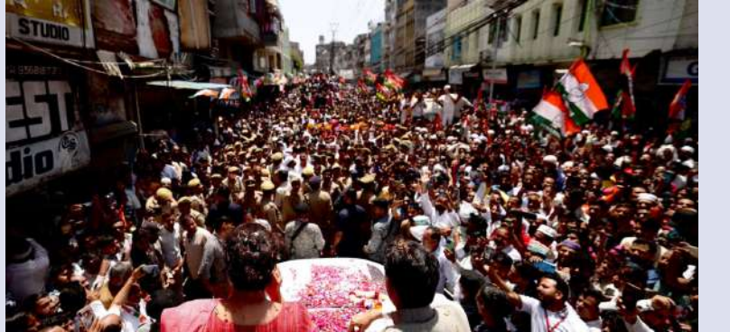
రాజకీయాలను ఆశించడం లేదని ప్రియాంక గాంధీ అన్నారు. పదేళ్లుగా సామాన్య ప్రజాసేవ, మహిళల జీవితాల్లో ఎలాంటి మార్పు లేదని, ఉద్యోగాలు లేవని, ధరలు కిందకు దిగడం లేదని అన్నారు. ఇది పండుగల సీజన్ అయినప్పటికీ, బుద్ధవారం రానున్న సమయం చేసుకుంటున్నప్పటికీ ప్రజలకు దగ్గర వదిలి కొనసాగుతున్నారని అన్నారు. 'ఆయన (ప్రధాని) నిరుద్యోగం గురించి మాట్లాడుతూ, ప్రవృత్తిని ఉపసంహరించారు. ఆయన చుట్టూ ఉన్నవాళ్లు కూడా ఆయనకు ఈ విషయం చెప్పారు.

శ్నించారు. వాళ్లెవరూ టిక్కెట్లు ఏ ఆధారంతో 400కు పైగా సీట్లు గెలుస్తామని అంటున్నారా? వాళ్లు ఇంతకుముందు ఏదైనా చేసి ఉండాలి. లేదంటే 400 సీట్లు వస్తాయని ఎలా ధంకారం లేకుండా దేశంగా స్వచ్ఛంగా, నజాఫంగా ఎన్నికలు జరిగితే బీజేపీకి 180కి మించి సీట్లు రావని నేను దీమాగా చెప్పగలను. నిజానికి 180 కంటే తక్కువ సీట్లు వాళ్లకు వస్తాయి" అని ప్రియాంక గాంధీ అన్నారు. ప్రజలు మార్పుకోరుకుంటున్నారని, ఈతరహా