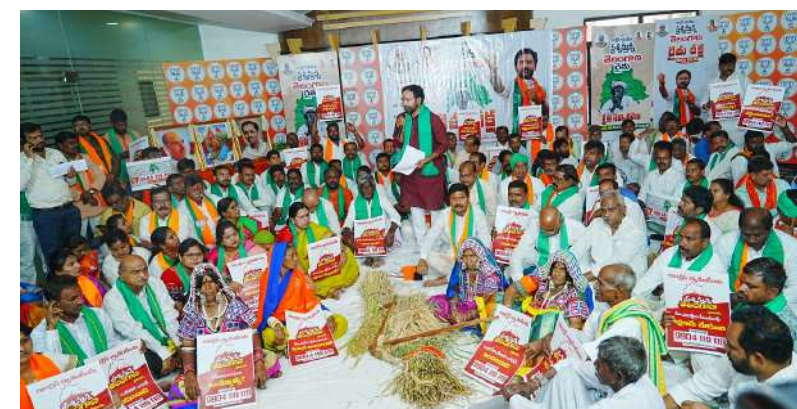
విశాలభారతి స్టేట్ బ్యూరో: